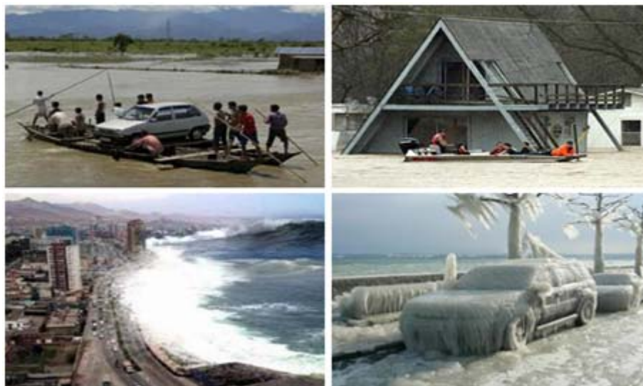
Figura 3. Diferentes desastres originados por el agua: inundaciones, tsunamis, heladas.

Algunos de los desastres naturales originados por el agua tienen que ver con grandes volúmenes de ella ubicados sobre áreas pobladas o cultivadas, afectando así miles de personas y diferentes aspectos de sus vidas como lo es la salud y la economía. También se presentan desastres por escasez o falta del recurso, como en las sequías. “Como primera cuestión, es necesario distinguir aridez de sequía. La aridez es una condición permanente y las sociedades que viven en los desiertos se han adaptado a ella, realizando las obras necesarias para suplir la falta de agua. Por el contrario, la sequía es un fenómeno circunstancial o esporádico que provoca un desastre” 4 .