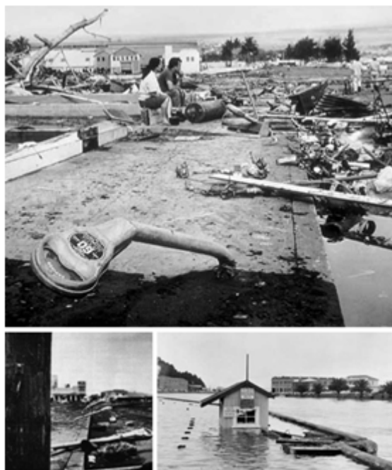
Figura 7. La imagen después de los desastres naturales causados por el agua.

Dos meses después del paso de Katrina por la ciudad de Nueva Orleans, el 80% del territorio se encontraba inundado y a pesar que la gran mayoría de la población fue evacuada, muchos decidieron permanecer en albergues dentro de la ciudad. Los reportes iniciales indicaron un total de 1.464 personas muertas; para el 28 de septiembre se contaban alrededor de 10.000. Los riesgos de enfermedades no demoraron; además de la deshidratación y el envenenamiento por comidas, eran inminentes los casos de hepatitis A, cólera, tuberculosis y fiebre tifoidea 6 .