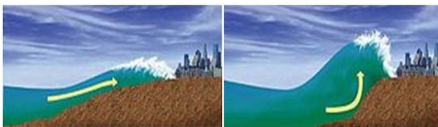
Figura 5. Aproximación de un tsunami a la zona costera.

Son diferentes las formas como se generan los maremotos o tsunamis, por lo anterior son diversas las fuentes que los originan; algunas causas son erupciones volcánicas, deslizamientos de tierra, meteoritos o explosiones submarinas 5 . A este tipo de maremotos se les denomina también “megamaremotos” y son característicos de olas de gran altitud pero de menor energía que las generadas por los maremotos tectónicos presentados anteriormente.