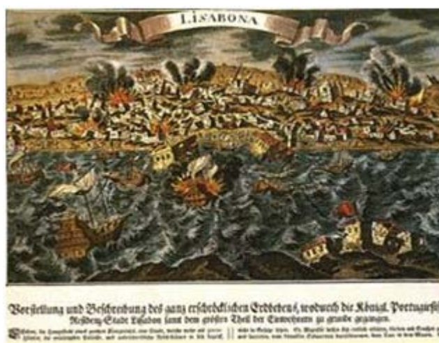
Figura 6. Caricatura del desastre natural en Lisboa, 1.755

La zona mediterránea también ha sido fiel testigo de la acción destructiva de los maremotos, específicamente el caso de Lisboa en el año de 1.755 donde miles de portugueses murieron pocos minutos después de su paso por la ciudad. “Antes de la llegada de la enorme ola, las aguas del río Tajo se retiraron hacia el mar, mostrando mercancías y cascacos de barcos olvidados que yacían en el lecho del puerto” 5 .