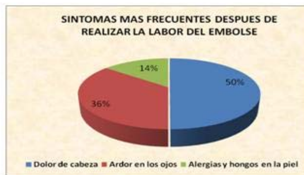
Gráfico 2. Síntomas más frecuentes después de realizar la labor del embolse.

Otros factores incidentes son: 1) El consumo de licor y la adicción al cigarrillo son factores que alteran los niveles de colinesterasa y se convierten en elementos tributarios de los descensos en su actividad. 70% de los embolsadores fuman en promedio cuatro cigarrillos al día. 2) La ubicación de las viviendas. 13% (tres trabajadores de 23) tienen las casas en lugares por donde circulan los aviones de fumigación y donde las familias del trabajador y el mismo se encuentran en permanente contacto con los agroquímicos por efectos de deriva. 3) El consumo de fruta de rechazo no lavada es práctica de 100% de los trabajadores quienes la consumen diariamente y la llevan para el consumo familiar.