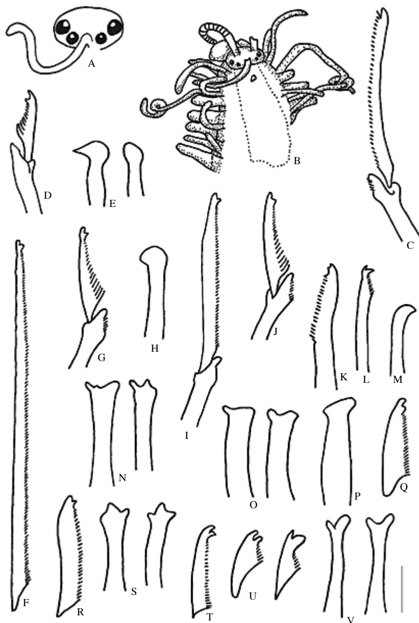
Figura 3. Perkinsyllis spinisetosa , A) prostomio. Perkinsyllis spinisetosa , B) parte anterior, C) espinífero anterior, D) falcífero anterior, E) acículas anteriores, F) espinífero medio, G) falcífero medio, H) acícula media, I) espinífero posterior, J) falcífero posterior, K) seta simple dorsal posterior, L) seta simple ventral posterior, M) acícula posterior. Perkinsyllis spinisetosa , N) acículas anteriores, O) acículas medias, P) acícula posterior. Sinmerosyllis lamelligera , Q) falcífero. Sinmerosyllis lamelligera , R) falcífero anterior, S) acículas anteriores, T) falcífero medio y U) acículas posteriores. Westheidesyllis cf. gesae , V) acículas. Escala 200 µm.

Discusión: Los ejemplares son similares al descrito para Cuba (San Martín, 1990); pero el ejemplar descrito por San Martín (1990) posee acículas que parecen bífidas, mientras que en los del Caribe mexicano hay una distalmente hinchada y oblicua, y otra capitada en setíferos anteriores y capitadas en setíferos medios y posterior en forma de L.