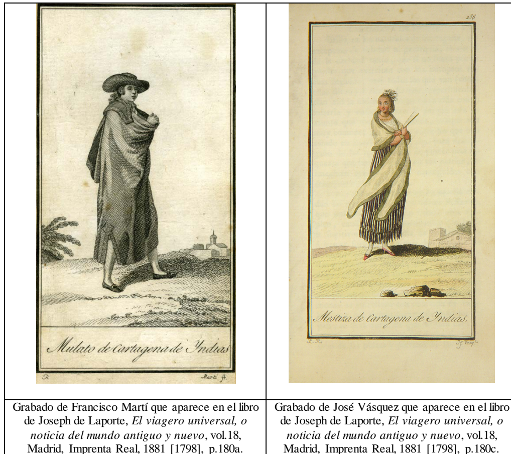
Figura 2. Mulato y mestiza de Cartagena de Indias