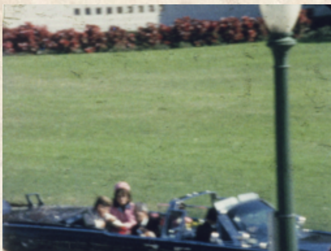
Figura 2: Fotograma de Zapruder Film © 1967 (Renewed 1995) (Abraham Zapruder, 1963). Fuente: The Sixth Floor Museum at Dealey Plaza.

emocionales con el material, pero al mismo tiempo este modo de lectura aportará nuevos significados y sentidos. Se trata, por tanto, de una historia cotidiana desconocida que traspasando las fronteras de la familia puede ser objeto también de diversos procesos de (re)significación tal como ha ocurrido en las corrientes contemporáneas del cine documental y como lo veremos en los siguientes apartados.