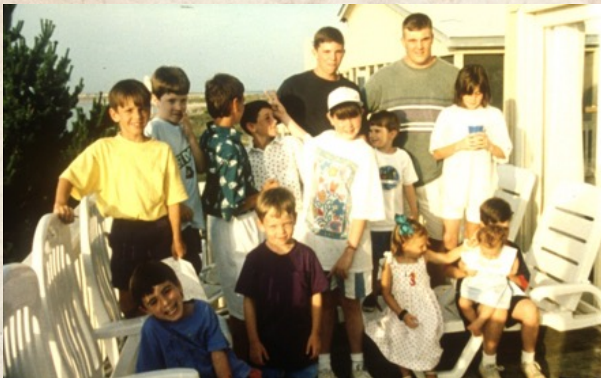
Figura 4: Fotograma de Time indefinite (Ross McElwee, 1993).

Efrén Cuevas, profesor de la Universidad de Navarra, es probablemente el académico más prolífico en torno a este tipo de cine y tras una estancia investigadora en Estados Unidos, editó el libro La Casa Abierta, El cine doméstico y sus reciclajes contemporáneos (Cuevas, 2010). Se trata de un compilatorio de ensayos de diferentes autores -incluidos Odin, Zimmerman, e Ishizuka- en los que se repasa el estado actual de la práctica del cine familiar y sus nuevas tendencias en el terreno del documental subjetivo. Antes de La Casa Abierta , Cuevas ya se había ocupado de los documentalistas americanos Alan Berliner y Ross McElwee, cuyas obras transitan, como se dijo antes, en el terreno del cine autobiográfico y familiar en el contexto del cine documental contemporáneo. Se trata, en definitiva, de obras que se basan en la propia vida e historia familiar de los directores que conjugadas a través de renovadas formas cinematográficas construyen nuevos discursos al universo familiar muchas veces contrarios a los que el cine familiar tradicionalmente ha planteado: problematizan la institución familiar y plantean cuestionamientos que muchas veces la