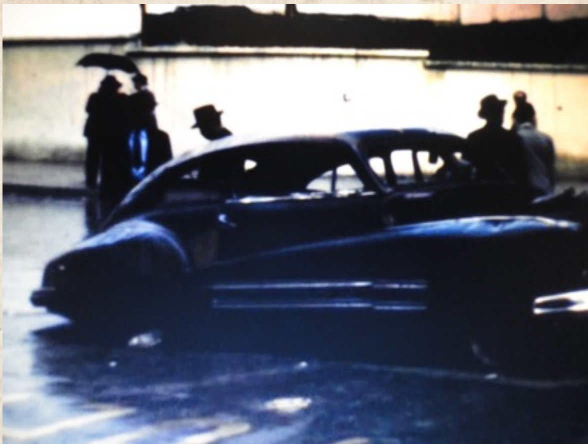
Figura 5: Fotograma de Cesó la horrible noche (Ricardo Restrepo, 2014).

cine familiar. Patricia Iriarte y Waydi Miranda (2011), publicaron el resultado de la investigación Usos del Audiovisual en el Caribe Colombiano . En dicha publicación, los autores presentan, según sus propias palabras, una extensiva e intensiva cartografía del proceso de apropiación social del audiovisual en la región Caribe colombiana, focalizando el interés del estudio en las organizaciones sociales, aunque también se incluyeron algunas instituciones públicas y privadas tales como centros educativos, salas de exhibición, compañías productoras y canales de televisión regionales y locales. Esta investigación permitió una mirada panorámica al quehacer audiovisual en la región y un mapa de los actores: personas jurídicas, naturales, asociaciones, colectivos, instituciones que participan de este proceso. Se concentró principalmente en la producción correspondiente a la etapa digital de la producción en el Caribe. El objetivo fue demostrar que todas estas iniciativas audiovisuales de la