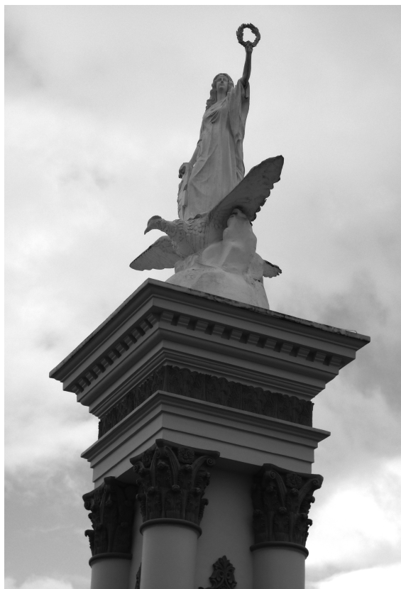
Parque 20 de julio (1910), Efigie de la libertad (1930), Ipiales Colombia. Fotografía Ángel Román 2011

El corregimiento de Monterrey (sur de Bolívar) es un territorio de frontera agrícola en proceso de cierre en la región del Magdalena Medio colombiano, que ha vivido inmerso en una lógica de violencia generada por los diversos actores armados que se disputan el territorio. Esta