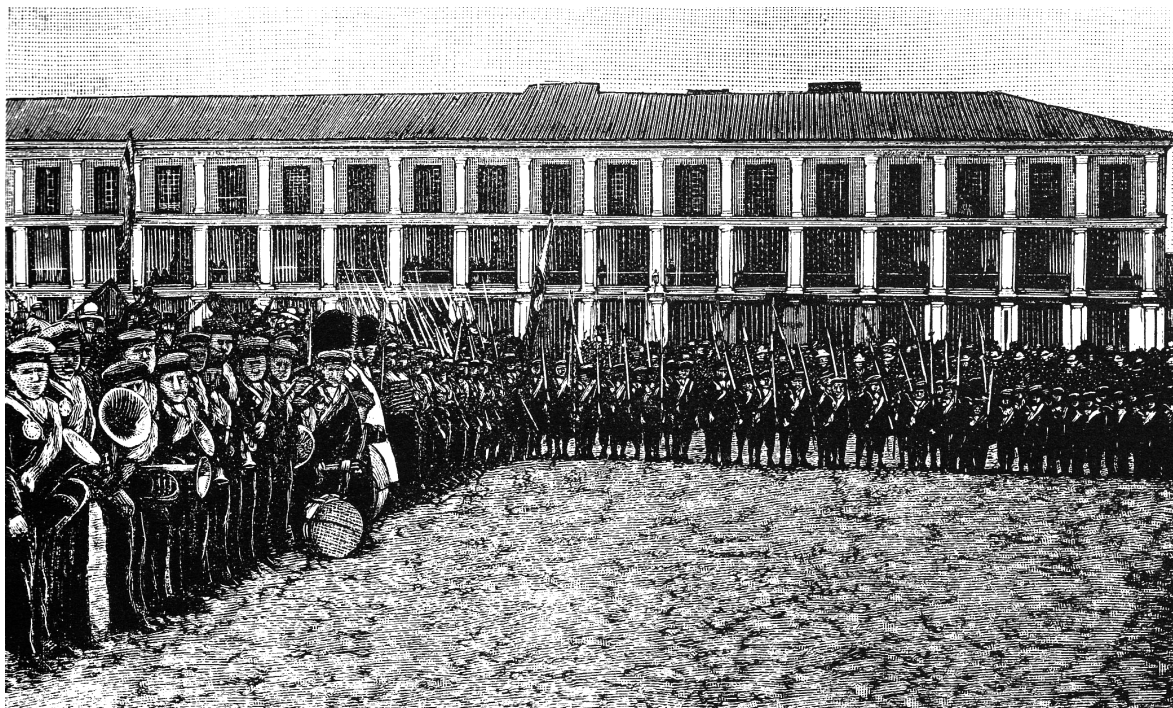
Centenario del libertador. Los niños desamparados. Papel Periódico Ilustrado, 1883, Tomo III, año III, p. 25. Banco de la República.