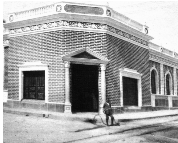
Imagen 4. Fotografía de Floro Manco utilizada por Jaime Colpas Gutiérrez, "Barranquilla, tierra y crisol de emigrantes", en Soy río, soy mar, soy Atlántico , ed. Carlos Rodado Noriega (Bogotá: Gobernación del Atlántico, 2007), 134. La fotografía la hemos recortado con el objetivo de poder observar con mayor precisión el proceso de irrigación.

La fotografía es de finales de la década de 1930 y hace parte de la colección personal de Helkin Núñez (Funcionario del Archivo Histórico del Atlántico).