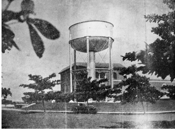
Imagen 1. Planta de filtración del acueducto de Barranquilla

El acueducto abastecía a los barrios habitados por la élite y autoridades locales, además de las fábricas y casas comerciales.