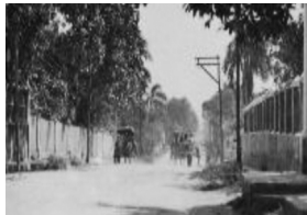
Imagen 3. Avenida de la República

La fotografía es de finales de la década de 1930 y hace parte de la colección personal de Helkin Núñez (Funcionario del Archivo Histórico del Atlántico).