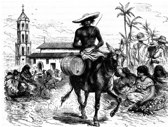
Imagen 5. Aguador de Barranquilla

BPC, América pintoresca. Descripción de viajes al nuevo continente por los más modernos exploradores: Carlos Wiener, Doctor Crevaux, D. Charnay, etcétera, etcétera (Barcelona: Montaner y Simón Editores, 1884), 493.