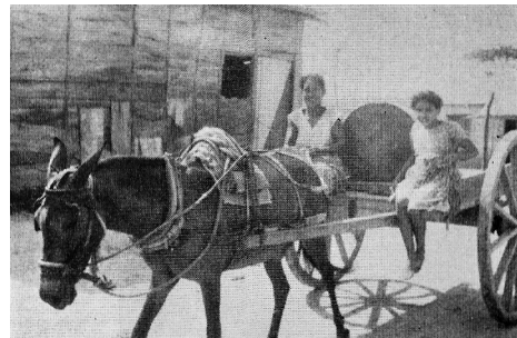
Imagen 6. El Bosque

BPC, América pintoresca. Descripción de viajes al nuevo continente por los más modernos exploradores: Carlos Wiener, Doctor Crevaux, D. Charnay, etcétera, etcétera (Barcelona: Montaner y Simón Editores, 1884), 493.