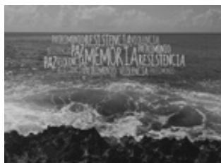
Imagen de portada: San Andrés, 2013. Ximena Trujillo