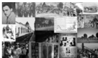
Imagen de portada: Collage creado a partir de las imágenes de portadilla de casa artículo. Creado por Juanita Giraldo.