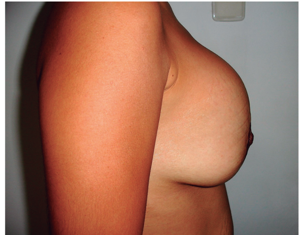
Figura 7. Deformidad en Snoopy