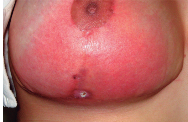
Figura 6. Celulitis en post quirúrgico de cirugía mamaria

sea de índole reconstructiva o estética, el cual no está exento de complicaciones que pueden llevar al deterioro de la calidad de vida del paciente y solamente el conocimiento de estas complicaciones permitirá su prevención, diagnóstico y manejo temprano.