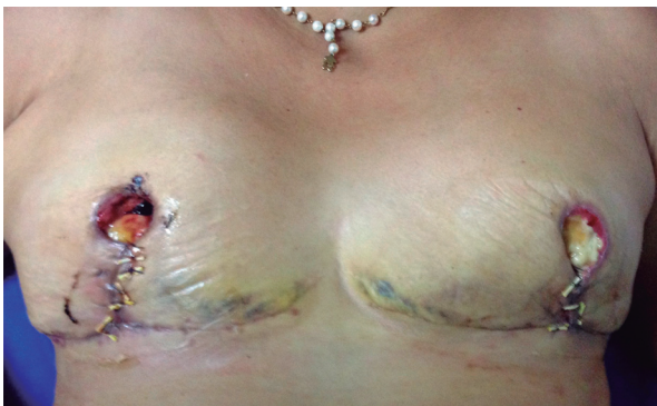
Figura 3. Necrosis total de complejo areola pezón en mamoplastia de reducción

La forma en que cicatrizará una cirugía mamaria es difícil de predecir por la naturaleza misma y particularidad de cada paciente. Es posible hacer una