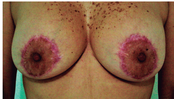
Figura 5. Cicatriz ensanchada e hipertrófica en mamoplastia de aumento más mastopexia

La vida útil de los implantes mamarios es en promedio de 10 años. Pueden estar asociados a complicaciones como la presencia de seroma, el cual se presenta generalmente en mamoplastia de aumento, debido a la reacción a cuerpo extraño secundario al implante. Otra complicación es la contractura capsular, la cual consiste en la presencia de un tejido fibroso que envuelve la prótesis mamaria con posterior engrosamiento y contracción, generando induración, rigidez y dolor en la mama. Además, las pacientes pueden presentar asimetría mamaria marcada, desplazamiento del CAP y pérdida de la forma normal del seno. La exposición de prótesis se