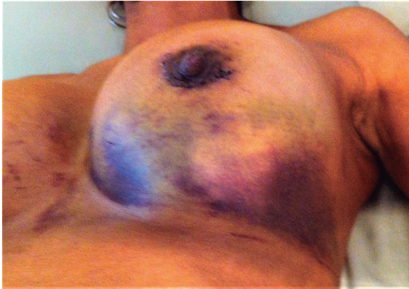
Figura 1. Hematoma en mama derecha en post quirúrgico de mamoplastia de aumento

La dehiscencia de la herida quirúrgica aunque se puede presentar en cualquier cirugía mamaria tiende a ser más frecuente en la mamoplastia de reducción (Ver Figura 4).