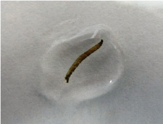
Figure 2. Larval L1 of Ornidia sp.