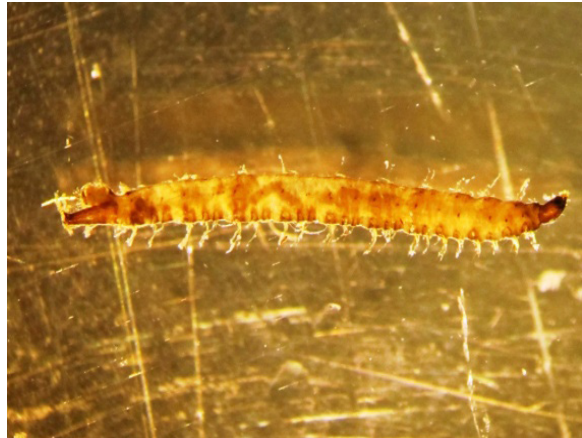
Figure 3. Larval L1 of Ornidia sp.