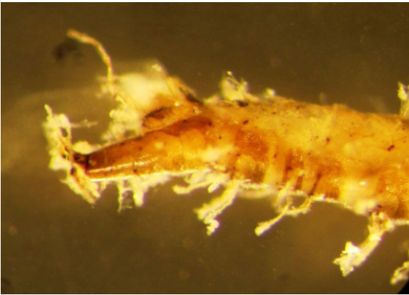
Figure 4. Ornidia sp. , Posterior extremity.