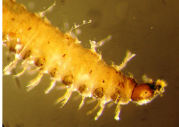
Figure 5. Ornidia sp. , anterior end

can be classified into specific , semi-specific and accidental . Specific are those due to larvae that feed on living tissues, such as C. hominivorax , D. hominis . Semi-specific or secondary myiasis are those caused by larvae that survive feeding on necrotic tissues, for example: C. macellaria , Sarcophaga sp ; And accidental myiasis, as its name implies, is installed by accident and caused especially by M. domestica , F. canicularis , and species of the family Syrphidae as Eristalis tenax and O. obesa , as the case reported in this work (2, 10).