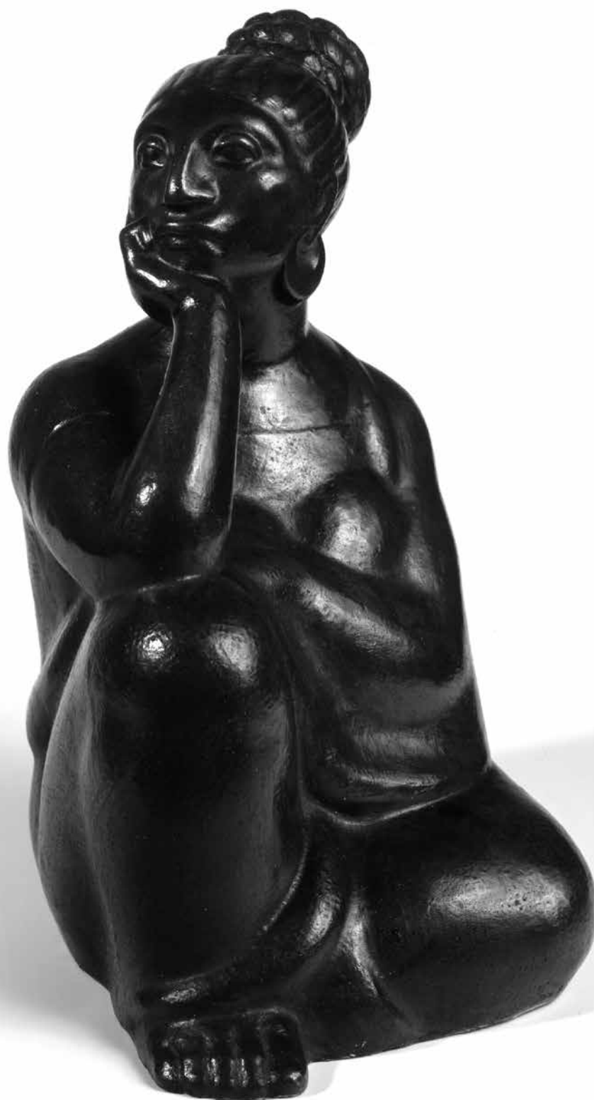
Mestiza , fundición (bronce), 1936 | 35,5 x 19 x 22 cm RÓMULO ROZO | REG. 3165, COLECCIÓN MUSEO NACIONAL DE COLOMBIA