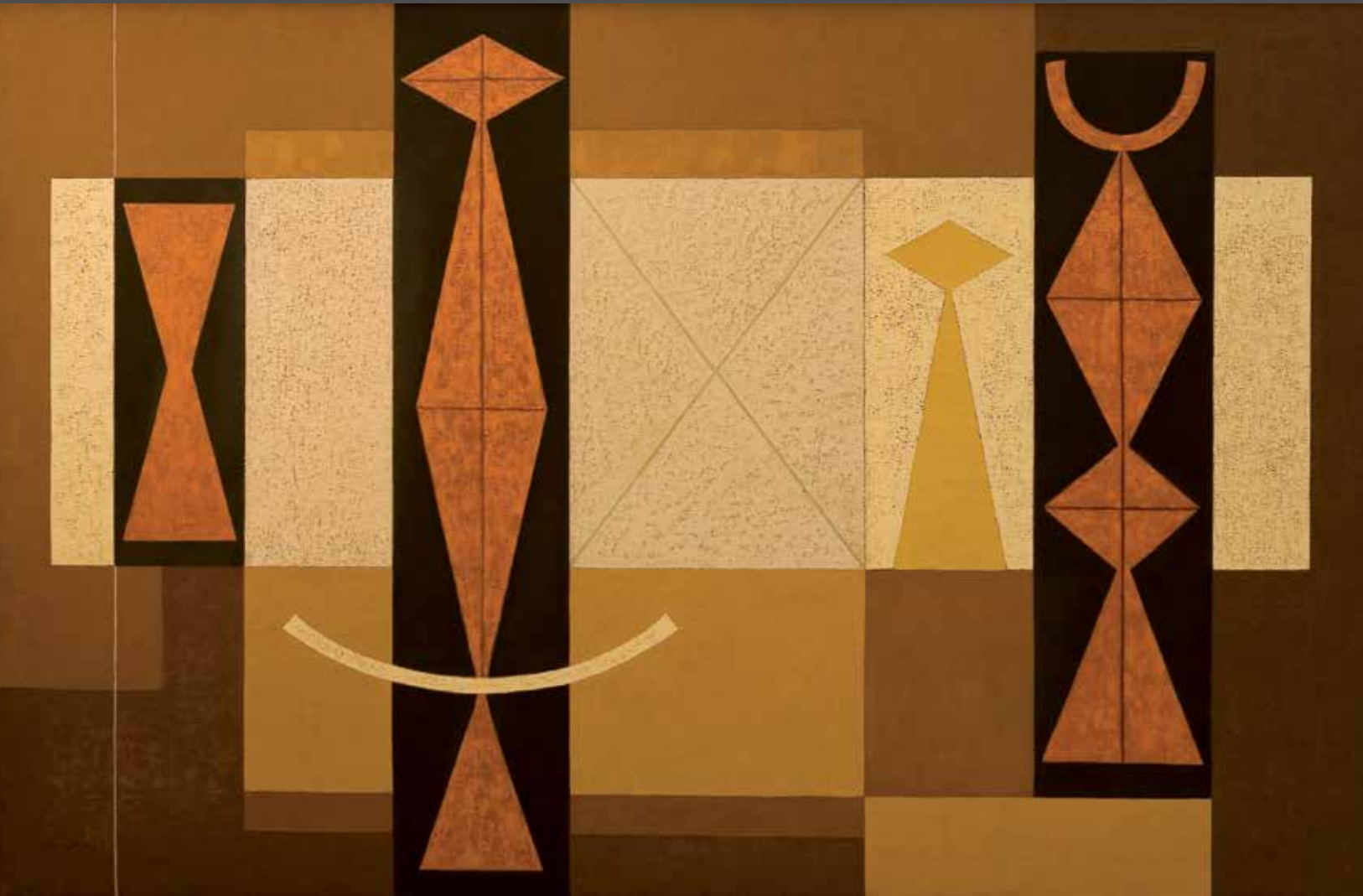
Encuentro inesperado , óleo sobre tela, 1952 | 130 x 200 cm MARIO CARREÑO | COLECCIÓN MUSEO NACIONAL DE BELLAS ARTES (CUBA)