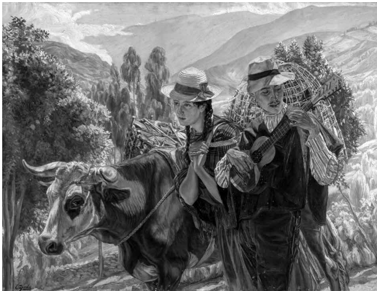
Camino al mercado , pintura (óleo / tela), Ca. 1926 | 108 x 142,5 cm EUGENIO ZERDA GRACÍA | REG. 2144, COLECCIÓN MUSEO NACIONAL DE COLOMBIA

concepto más radical que circula a partir de los aportes a la materia realizados por Eduardo Kac —artista brasileño referente del campo—. Kac ha bautizado su propuesta como arte transgénico que se basa en el uso de las