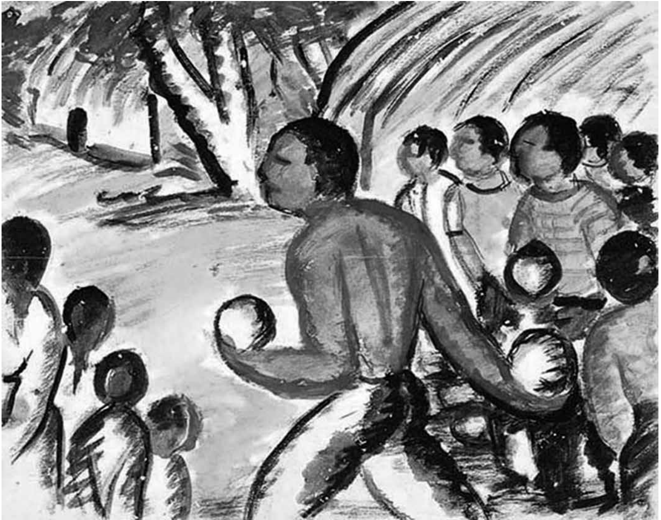
Juego de bolas criollas , acuarela sobre papel | 1930 | 24 x 30,5 cm FRANCISCO NARVÁEZ | CÓDIGO: AC-022, FUNDACIÓN FRANCISCO NARVÁEZ (VENEZUELA)

to de lo humano a través del uso de la razón. Con la razón como centro y motor de progreso y acceso a la verdad, y como característica fundamental de esta idea de ciencia, la modernidad excluyó a quienes no creía con capacidad para razonar.