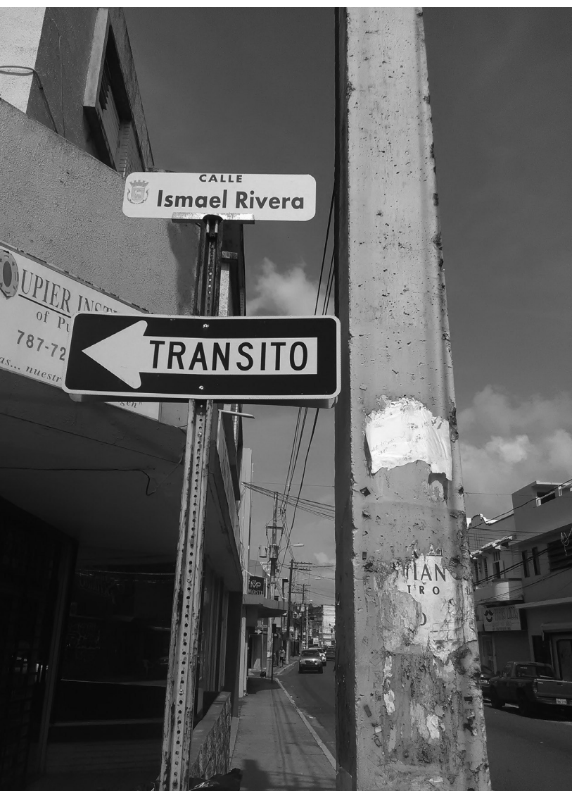
■ Calle Ismael Rivera, San Juan (Puerto Rico) | Foto: Robert Téllez, 2016

la agrupación de Cortijo y grabó los discos Bienvenido (1966) y Con todos los hierros (1967).