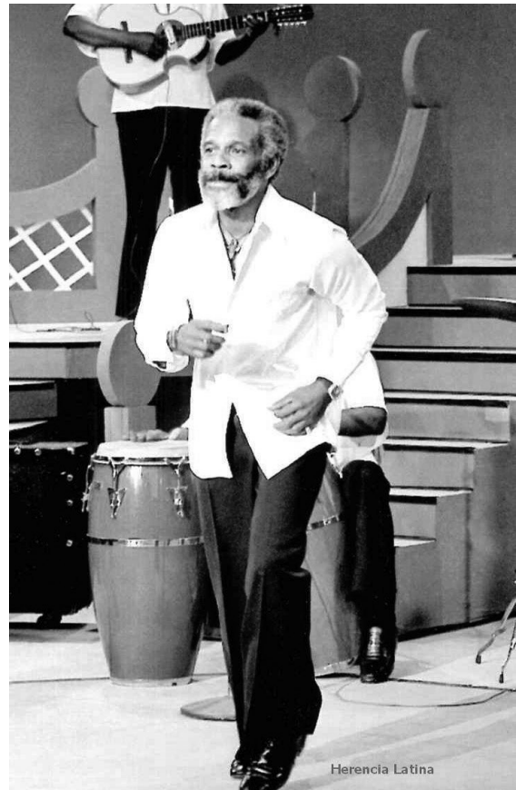
■ Ismael Rivera, 1979. Tomada de El Libro de la Salsa, de César Miguel Rondón.