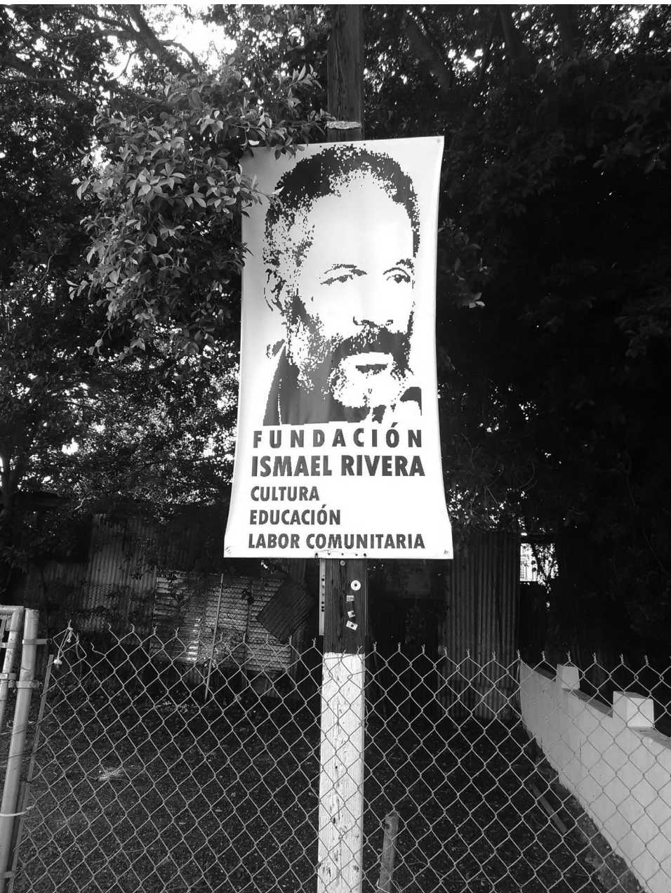
■ Fundación Ismael Rivera, San Juan (Puerto Rico)

Tras recuperar su libertad, Ismael regresó a Puerto Rico, donde encontró seguidores, pero también algunos detractores que lo consideraban un mal ejemplo para la sociedad. En 1966 se reintegró a