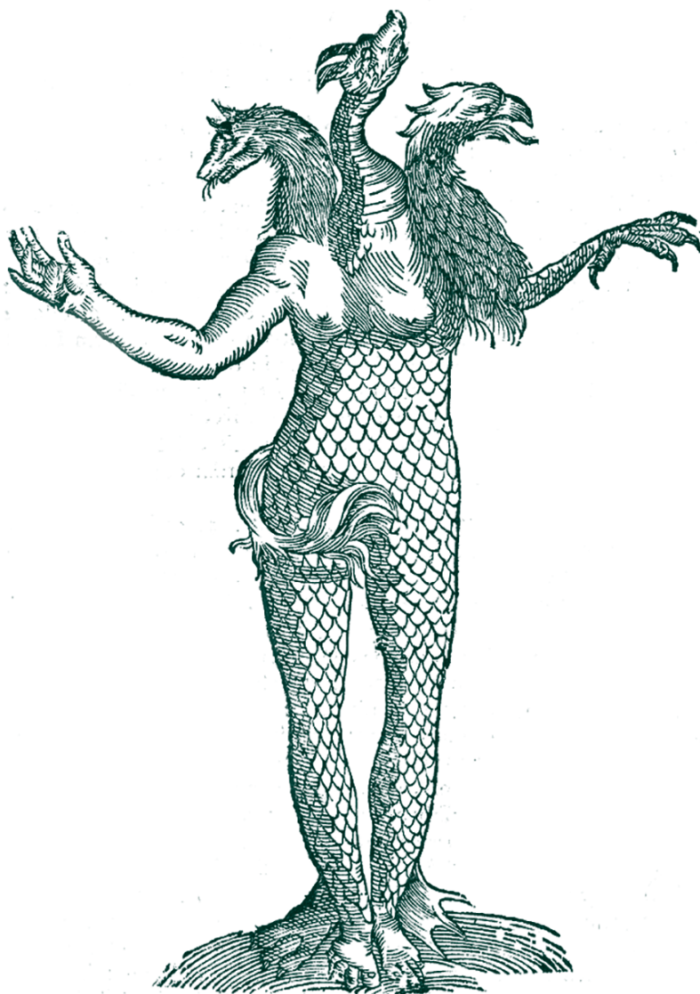
■ Monstrum triceps capite Vulpis, Draconis & Aquilae | Ulysses Aldrovandi, "Historia de los monstruos"

rechazo de los canales de mediación y agregación política de la democracia liberal y la búsqueda de prerrogativas o transformaciones estatales. La perspectiva más acabada de esta comprensión la ofrece el exvicepresidente y sociólogo boliviano Álvaro García Linera, para quien "los levantamientos de 2003 han sido la expresión máxima de la disidencia de la plebe respecto al Estado Neoliberal-Patrimonial, y por tanto del agotamiento de esta forma estatal", pero "tampoco hay disidencia exitosa sin la capacidad de postular un orden Estatal alterno", y las acciones tras las barricadas "[fueron capaces] de paralizar al Estado, pero sin ser ellas mismas un proyecto de poder alterno y legítimo" (García, 2009: 439-440). En esta perspectiva, la relación con el Estado tiende a hacerse el criterio por excelencia de verificación y de validación del éxito, la eficacia o la legitimidad de los levantamientos. Frente a lo anterior es necesario recordar, si-