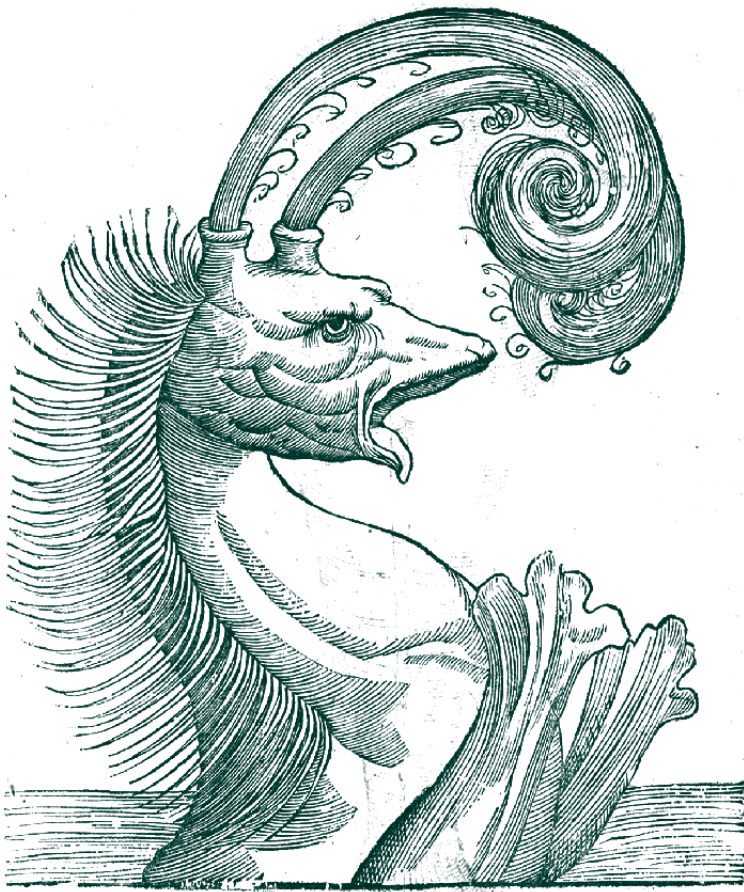
▪ Pseudophyseter | Ulysses Aldrovandi, "Historia de los monstruos"

la política , que se refiere a las premisas ontológicas que subyacen los conflictos políticos, abordadas en el acápite anterior, y una dimensión política de la ontología , que se refiere a las formas de ver y hacer política que emergen de ontologías específicas (Escobar, 2014). Esta complementariedad nos indica, en primer lugar, que en los conflictos políticos se encuentran inmersas premisas ontológicas no siempre convergentes, y que parte integrante del conflicto es justamente aquello que sus actores entienden por lo real, lo existente, el ser y la vida; y en segundo lugar, nos indica también que de esas premisas ontológicas se siguen formas de acción política y racionalidades políticas específicas, que determinan las formas mismas que toman los conflictos, las estrategias que se ponen en juego y las acciones que se despliegan. En virtud de esta perspectiva articulada por Escobar, podemos sostener que si nos parece propio de la mitología o de la superstición que las comunidades nasa afirmen que el espíritu mayor del trueno tiene una agencia política, es debido a la primacía que concedemos a la ontología política hegemónica, que impide aproximarnos a otras formas de comprender lo real y lo vivo, y que si nos parecen excesivas