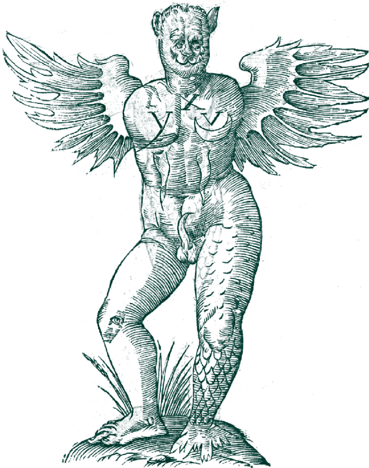
▪ Monstrum cornutum, and alatum aliud | Ulysses Aldrovandi, "Historia de los monstruos"

indígena hunde sus raíces en la Ley 89 de 1890, primera ley sobre indígenas de la República, que determinaba cómo debían “ser gobernados los salvajes que fueran reduciéndose a la vida civilizada”, y se extiende, a través de múltiples vaivenes, hasta la Constitución de 1991 que, a través de la promulgación del carácter pluriétnico y multicultural de la nación, constituye a los indígenas como sujetos de derechos diferenciales en materia de participación política, transferencias económicas, aplicación de justicia, salud, educación, entre otros, a la vez que consagra su subordinación al ordenamiento y las dinámicas político-administrativas estatales (Chaves, 2011).