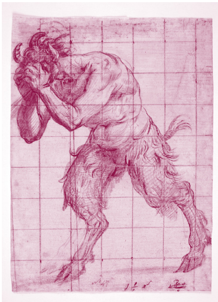
▪ Demonio huyendo , 1632 | Vicente Carducho. Museo del Prado

a través de la creación de una red de colaboraciones entre revistas de todo el continente, Europa, Estados Unidos, e incluso la Unión Soviética. Su sello sería la interdisciplinariedad.