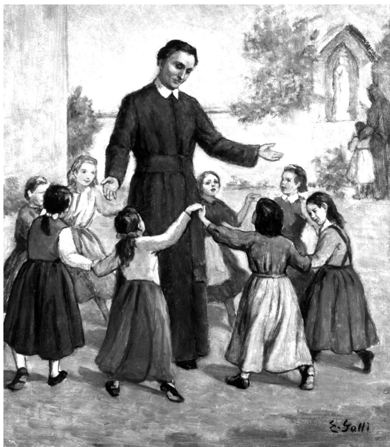
▪ El Santo, padre de huérfanos

¿De qué tipo de utopía hablamos en Espiral ? El eje esencial se construye en torno a la construcción de un campo cultural latinoamericano que profundice en el conocimiento de su historia, en el reconocimiento de la invisibilidad a la que ha sido sometida la mirada propia sobre nuestra forma de vivir, en el establecimiento de una serie de coordenadas críticas que fortalezcan un destino común. De allí, por ejemplo, el combate de pintores como Luis Alberto Acuña y Marco Ospina a lo largo de más de la mitad de los números de la revista. Este es uno de los aspectos más destacados de Espiral , una preocupación por pensar la “cultura nacional”, sin caer en nacionalismos, con el prisma puesto en una visión latinoamericana. La revista Espiral logró crear un puente entre derrotados, entre generaciones y entre