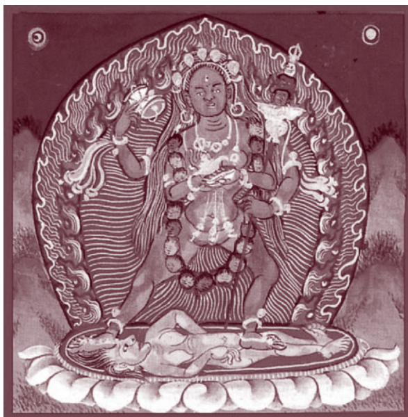
■ Vajrayogini Armor Chandika