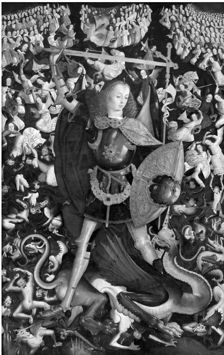
▪ San Miguel Arcangel , 1475 | Maestro de zafra, Museo del Prado