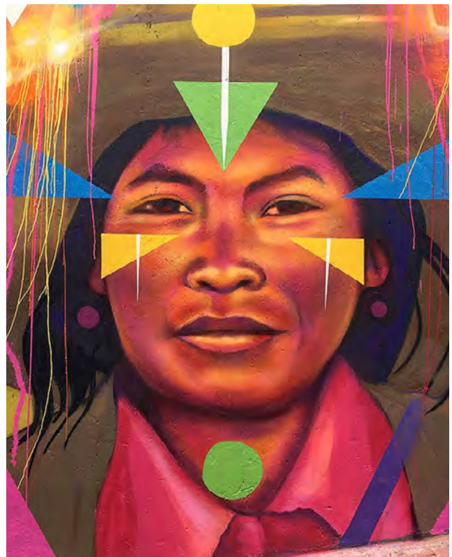
■ Sin título , basado en una foto de Lucas Rodríguez, Barrio La Concordia, Bogotá (Colombia), 2018 | Guache

Así, sugiero observar la emergencia de "ideología de género" en Colombia como un mecanismo para obtener poder político que surge, se nutre y hace parte de las políticas del género y la sexualidad menciona-