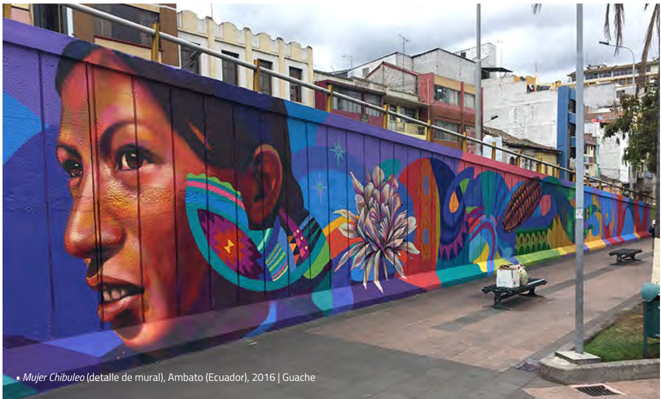
▪ Mujer Chibuleo (detalle de mural), Ambato (Ecuador), 2016 | Guache

Sin embargo, qué tan articuladas, intencionadas o estratégicas son estas acciones, merece mayor discusión. No se trata sólo de una reacción antagonista, como sugiere el uso de conceptos como movimientos antide-rechos o antigénero , pues hay en tales movilizaciones un interés en producir nuevas políticas del género y la sexualidad, y un recurso a discursos de derechos. Sin embargo, como encontró la investigación que soporta este artículo, para el caso de los usos políticos de la homofobia, la decisión de desplegar tales iniciativas puede llevar a efectos diferentes a los planeados. La politización de la homofobia se usa en una variedad de situaciones, y obtiene resultados diferenciados, ambivalentes e incluso inesperados. Así, es necesario revisar atentamente la noción de intención que subyace en las conceptualizaciones que hacemos de estas movilizaciones y estrategias políticas. “Ideología de género” puede ser desplegada en la retórica de proyectos políticos autoritarios y totalitaristas, pero su mera presencia no implica resultados directos en las políticas del género y la sexualidad, pues depende de una variedad de