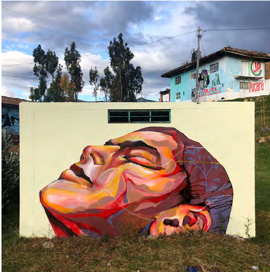
▪ Sin título, Festival Despierta, Huancayo (Perú), 2019 | Pésimo

América Latina, permite ver ritmos contradictorios de cambio. Un ejemplo lo constituye el caso argentino donde, a pesar de la influencia de la Iglesia católica, se han dado transformaciones en temas de diversidad sexual pero resistencias en asuntos como el aborto (Pecheny et al. , 2016). Casos como los de Colombia o Brasil, donde han sido iglesias pentecostales con presencia en partidos políticos quienes lideran el tema de “ideología de género”, merecen ser abordados desde dimensiones políticas no explicadas tan sólo en discusiones teológicas o de influencia vaticana.