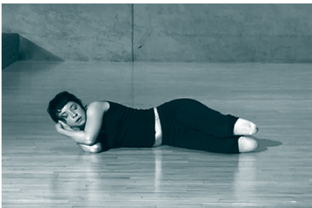
■ Mujer acostada de lado sobre el piso en el escenario. Lisa Bufano, artista de performance estadounidense en la obra “Open Mouths”, 2007

Por tales motivos, según el Manual Diagnóstico y Estadístico de los Trastornos Mentales (DSM-5) (APA, 2014), el trastorno negativista desafiante (TND) 33 es un patrón de enfado e irritabilidad que nos conduce a la pérdida de la calma y al resentimiento, así como a discusiones y actitudes desafiantes, además de que se rechaza satisfacer a las figuras de autoridad (culpar a los demás por sus errores o su mal comportamiento), en este sentido, el TND impulsa una concepción patológica del yo que necesita corrección y transformación terapéutica orientada a la competencia de las emociones positivas (¡si quieres, puedes!) 34 .