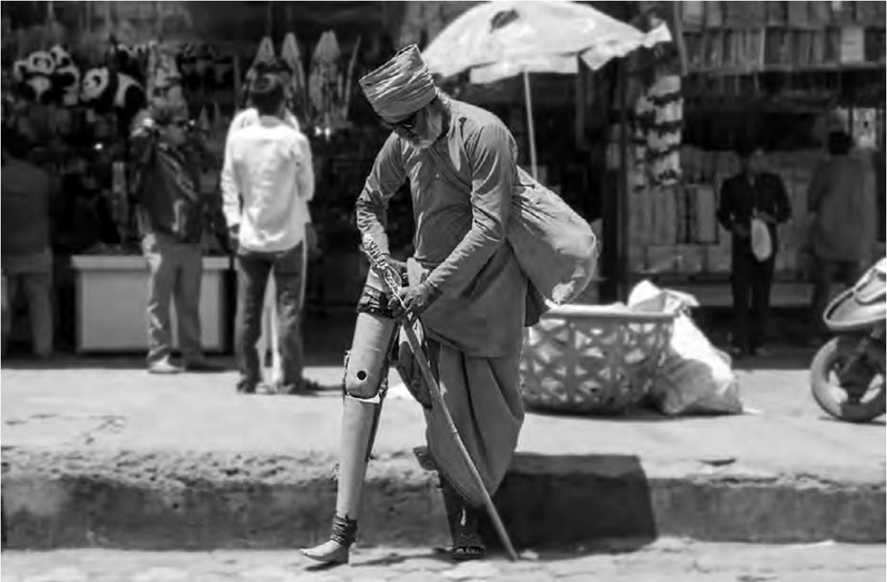
▪ Hombre Indio en la calle con prótesis de pierna y bastón

tes a lo largo del debate, haciendo uso del recurso de consenso. Este recurso es un mecanismo exteriorizador, según el cual, un hecho se presenta como compartido por varios productores, proporcionando una corroboración de factualidad (Potter, 1998). Con ello, hay un distanciamiento del argumento, lo que genera una descripción independiente del sujeto que la produce. Con esto, la justificación central de la aprobación de la normativa bajo estos repertorios radica en el consenso compartido por distintos agentes, argumento que prima por sobre otros relacionados con la participación y la inclusión social de la población con discapacidad. Aquellos argumentos sostenidos bajo una participación activa de las PcD se presentan con menor fuerza de aparición, como se verá más adelante. Por otra parte, los discursos sostenidos en comparaciones con países más avanzados en esta materia, ubicados en el “Norte global” o pertenecientes a la Organización Internacional de Cooperación y Desarrollo (OCDE), operan como sustrato de validación de la colonización con aspiraciones de desarrollo: