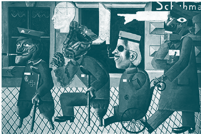
▪ Dibujo de cuatro militares mutilados de piernas o brazos , Otto Dix, 1920