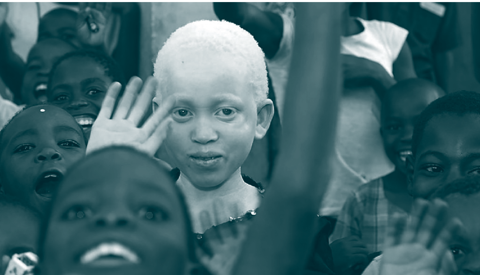
▪ Niños africanos saludando sonrientes a la cámara, entre ellos un niño albino, África, 2016

El resultado de las actitudes capacitistas es la desvalorización de la discapacidad y la construcción de un sujeto incompleto, materializado en la estructuración sociopolítica de la precariedad de su cuerpo, muchas veces integrado a nivel sociojurídico pero discriminado simbólicamente (Balza, 2011). Una ejemplificación de este sujeto incompleto se refleja en la siguiente cita: