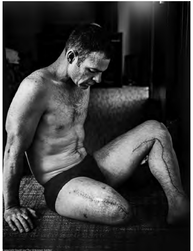
▪ Foto de hombre sin una pierna, semidesnudo, sentado en el piso, 2007