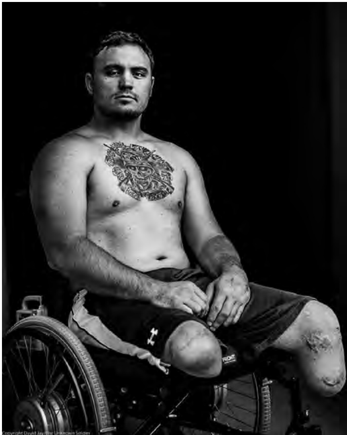
▪ Foto de hombre sin piernas, sentado en silla de ruedas, 2007

Derivada de esta racionalidad, emerge la ley de inclusión laboral que, discursivamente orientada hacia la reivindicación del derecho al trabajo, deja de manifiesto ser un avance neocolonial de poder sobre los cuerpos. Los resultados dejaron ver que, mediante discursos dominantes, discapacita, individualiza y responsabiliza moralmente a quienes enfrentan desventajas estructurales (Grover y Piggott, 2010). La cooptación estatal del derecho al trabajo como discurso individualizador, en el marco de democracias liberales occidentales, ha devenido en el acceso a un espectro de derechos sociales, en base a la incorporación de la población con discapacidad en mercados laborales no calificados y de baja remuneración (Soldatic y Chapman, 2010). Esto deja de manifiesto la relevancia de considerar la