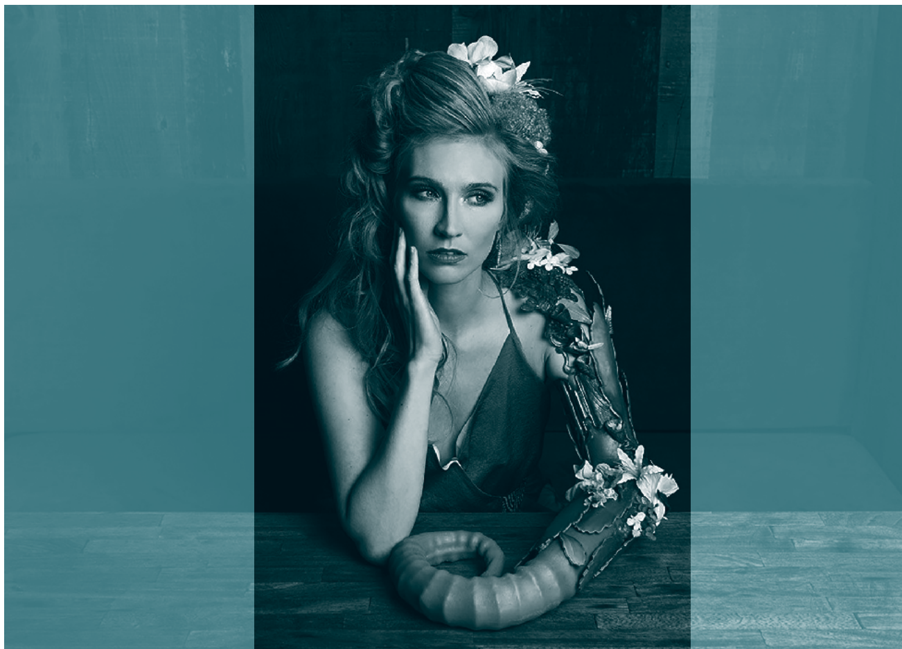
■ Mujer con una prótesis en su brazo elaborada por The Alternative Limb Projec

Tal como se puede apreciar a través de la cita, incorporar las PcD al mundo laboral es, de acuerdo con los hablantes, “rescatar la dignidad”. Con esto, se deja