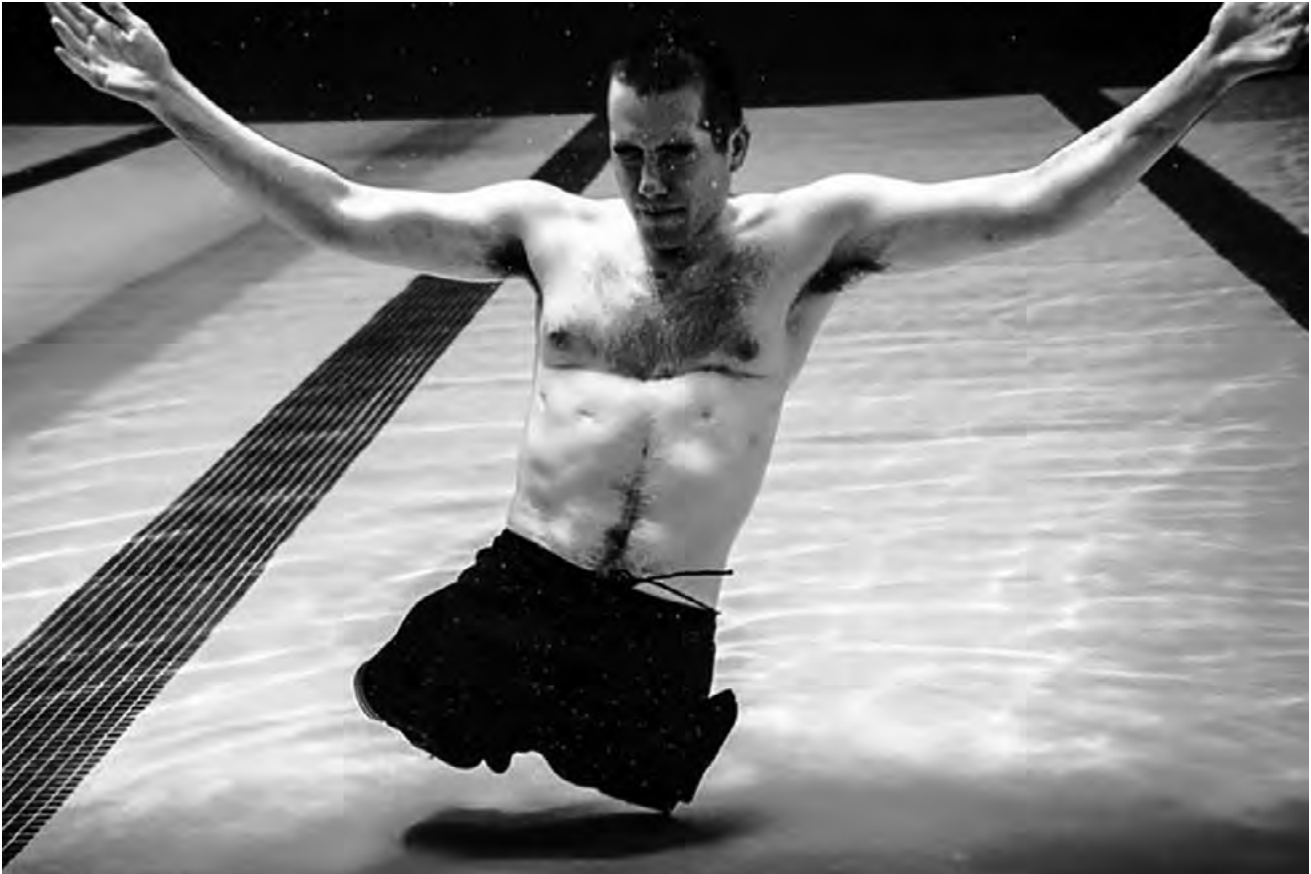
▪ Hombre sin piernas sumergido en una piscina , 2007

los espacios del Sur desde donde se configura y vive la discapacidad o los denominados por Grech (2015) cuerpos neocolonizados . Para este autor, las personas con discapacidad fueron impactadas por la colonización y no es posible abordarlas fuera de su historia. Es por ello por lo que nos brinda una lectura de la violencia vivida por los cuerpos en el colonialismo que consideramos necesaria para replantear nuestros marcos comprensivos de la discapacidad. La tremenda violencia generada por los castigos corporales coloniales, como parte de una lógica de disciplinamiento, dejó a muchos impedimentos visibles, de esta forma se configuró como un modo de controlar al “nativo”. Los cuerpos se convirtieron en el medio sobre el cual se exhibieron las diferencias, construyendo a un “otro” no sólo racial, sino también corporal. Con ello, el cuerpo violentado y libre del esclavo colonizado se convirtió en un cuerpo “discapacitado”, expresión de las consecuencias de la subversión, así como una herramienta de disciplina y regulación. Este cuerpo mutilado, ingobernable, incivilizado, pero también expresión de resistencia, pasó a ser a la vez un cuerpo improductivo. Con ello, el colonialismo re-