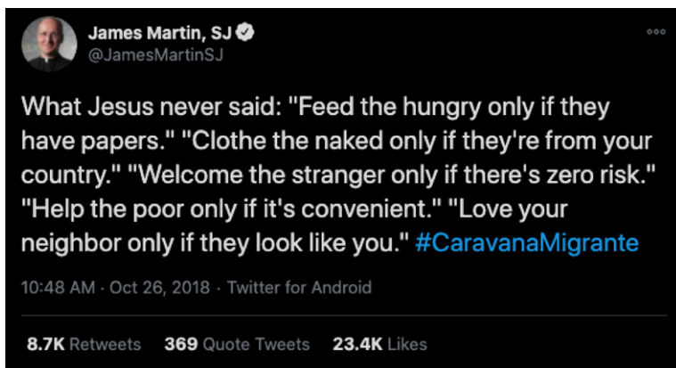
Figura 6. Trino de @JamesMartinSJ a favor de la caravana migrante

Por otra parte, James Martin SJ –padre jesuita estadounidense– se pronunciaba a favor de la caravana (Figura 6): “Lo que Jesús nunca dijo: ‘Alimenta a los hambrientos solo si tienen papeles’. ‘Viste a los que no tienen vestido solo si son de nuestro país’. ‘Dales la bienvenida a los extraños solo si representan cero riesgos’. ‘Ayuda a los pobres solo si es conveniente’. ‘Ama a tu prójimo solo si luce igual a ti [ ... ]” (traducción propia). Este fue el tercero de los mensajes con más retrinos dentro de las bases de datos con 7.851 registros totales. El trino contenía la etiqueta #CaravanaMigrante, pero no fue amplificado por ninguna de las cuentas consideradas como centrales durante el periodo de observación.