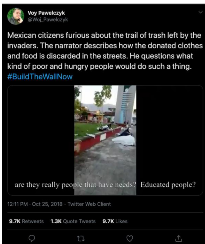
Figura 5. Trino de @PolishPatriotTM en contra de la caravana migrante

Otro trino, originalmente publicado el día 25 de octubre de 2018, a las 17:11:30, logró amplificación por las cuentas @AnnCarolPerry1 (bot) y @Jojoinguette (bot) y obtuvo 10.576 retrinos totales. El trino fue atribuido a la cuenta @PolishPatriotTM (ahora @woj_pawelczyk) con una posición evidentemente en contra de la caravana migrante. Este trino fue parte de la etiqueta #BuildTheWallNow: “Ciudadanos mexicanos furiosos por el rastro de basura que dejaron los invasores. El narrador describe cómo la ropa y alimentos donados se tiraron en la calle. Él se pregunta qué clase de gente pobre y hambrienta haría tal cosa #Contruyanelmuroahora [...] ¿Son en realidad personas que tienen necesidades?, ¿gente educada?” (traducción propia).