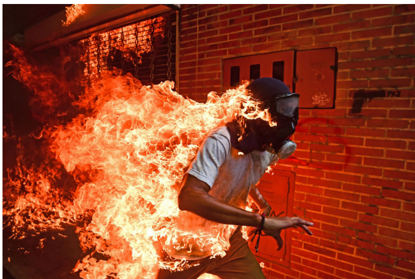
Figura 2. “Venezuela crisis” (2018)

* Autor: Ronaldo Schmidt; Photo Contest, World Press Photo of the Year; acontecimiento: marchas y protestas contra el gobierno de Nicolás Maduro.