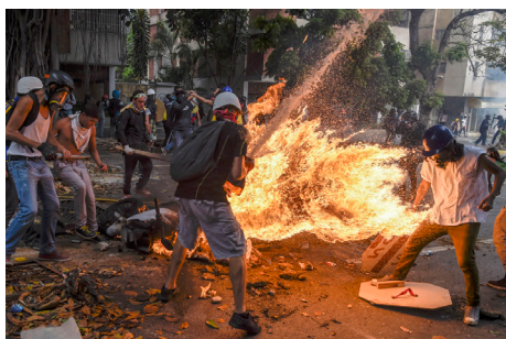
Figuras 3-9. Serie 1: Demonstrator Catches Fire (2018)