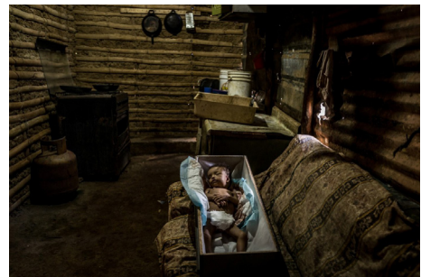
* Autor: Meridith Kohut; finalista Premios Pulitzer 2018, categoría Feature Photography; acontecimiento: la escasez, la desnutrición, la enfermedad y la muerte por desnutrición en Venezuela.