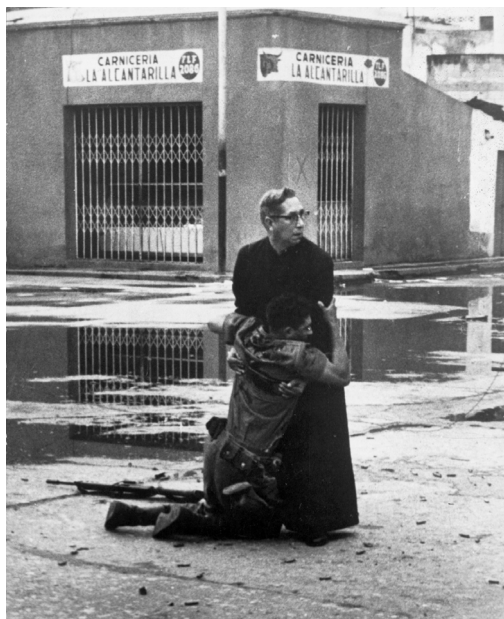
Figura 1. “El Porteñazo” (1962)*

* Autor: Héctor Rondón; Premio Pulitzer, Photo Contest, World Press Photo of the Year; Acontecimiento referenciado: alzamiento militar contra el presidente Rómulo Betancourt.