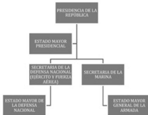
Figura No 1: Sistema de Defensa en México: relación de mando