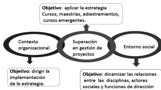
Figura 2. Objetivos de la estrategia de superación transdisciplinaria

a. Contexto organizacional: universidad con sus dependencias y organizaciones administrativas, investigativas, políticas y de masas (vicerrectorías, facultades, departamentos, centros de investigación, comisiones de carrera y consejos científicos) y su red-rizoma de