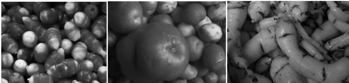
Figura 1. De izquierda a derecha: cuiibas, rubas y nabos

Otro producto agropecuario de gran importancia es el haba ( Vicia faba L.). Este acompaña la mayoría de las sopas que se consumen en Boyacá, tales como los ajiacos, cuchucos, rullas y los cocidos. El origen del haba es el Cercano Oriente y la subespecie V. faba paucijuga actualmente se encuentran en el terreno comprendido desde Afganistán hasta la India. Asimismo, se ha logrado determinar que el haba se ha cultivado desde los primeros tiempos del Neolítico (12). Acerca de sus propiedades nutricionales y anti-nutricionales, tanto para alimentación humana como animal, se tiene que dado el alto contenido de proteína que contiene es ideal para el desarrollo de alimentos para cerdos y aves de corral; sin embargo, el exceso de este producto puede reducir la asimilación