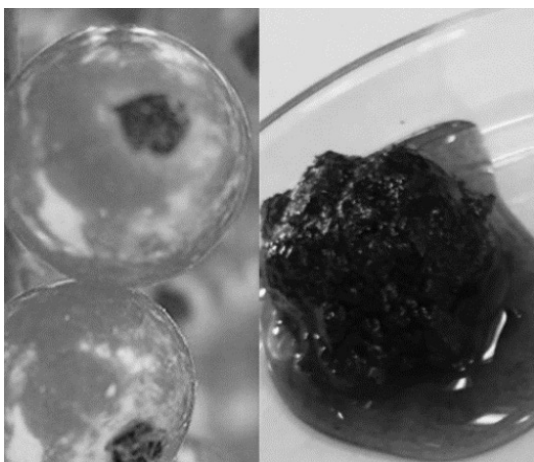
Figura 3. Dulce de grosella: textura líquida viscosa