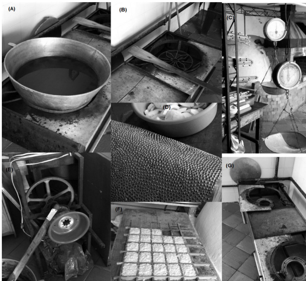
Figura 1. Utensilios y materiales para la elaboración de los dulces de Valledupar