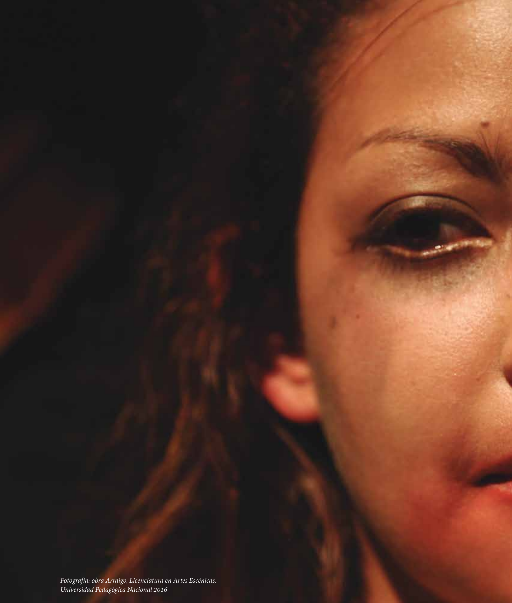
Fotografía: obra Arraigo, Licenciatura en Artes Escénicas, Universidad Pedagógica Nacional 2016