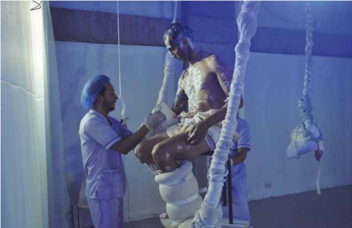
Figura 5. Maquillaje de "El fajadito"

Por lo anterior, el cuerpo del performance aquí descrito se convierte no en el lienzo para dejar allí una huella, sino que es dado como huella para afectar los sentidos del espectador. De esta manera, los espectadores son partícipes de un cuerpo afectado, que fue exaltado a través del maquillaje y de las diferentes invasiones que se realizaron para lograr una estética que mucho tiene que ver con la abyección. Había en cada giro de la gasa que cubría el cuerpo una historia diferente de los realmente mutilados en Colombia. No era, en este sentido, un vestuario del personaje, sino que las vendas y gasas utilizadas se convertían en elementos rituales que se disponían igualmente a través de un proceso que invitaba al ritual, a un estado de conciencia sobre la mutilación.