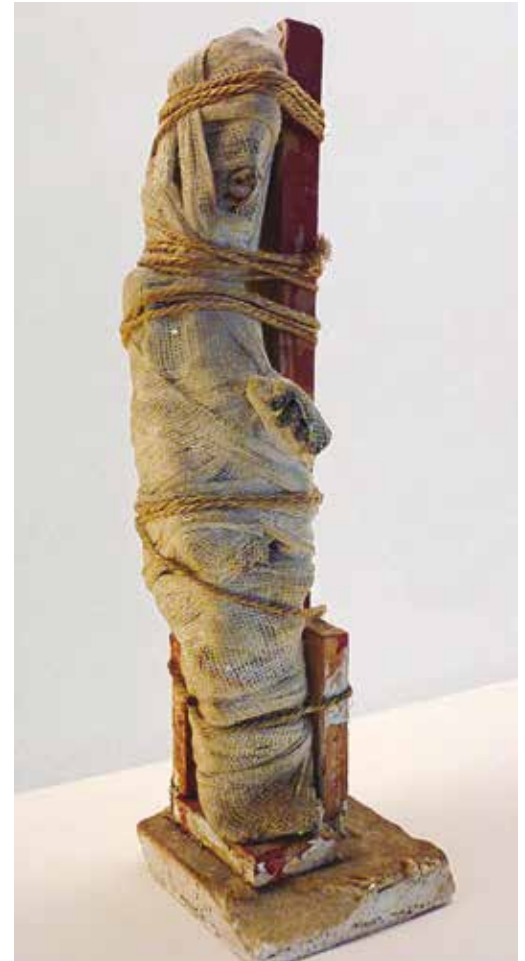
Figura 3. Fotografía de uno de los fajaditos Museo de Pablo Serrano, Zaragoza (España).

Pobrecitos, fajaditos, jodiditos en vida, muertecitos. Con una boca nada más, con un ojo nada más, con la nariz nada más, con un oído nada más. Fajaditos condecorados. Algo quieren decir, pero no pueden, están fajaditos. Tienen un libro. Tocan mal un instrumento. Sus cabezas son de tarro de farmacia, sus cabezas son de automóviles de plástico. Con un ojo solamente. Nada más con un bracito. Nada más, nada más nada, nada nada.