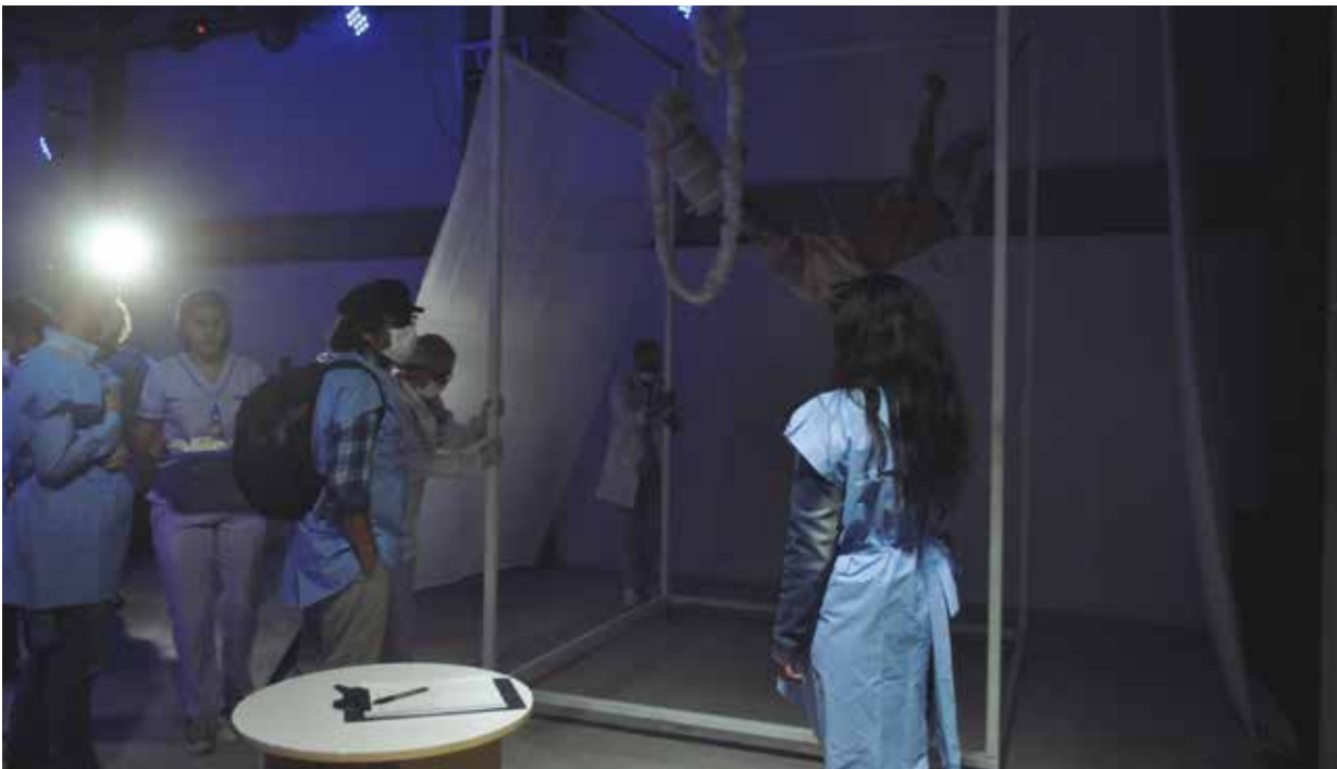
Figura 4. Escena en la que aparece “El Fajadito”