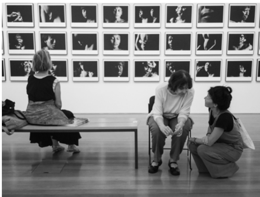
Figura 2. El Otro suma quién soy , 2019. Fotodiscurso compuesto por una fotografía digital en el Instituto Moreira Sales en São Paulo