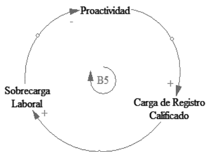
Figura 2. Ciclo de balance entre proactividad, sobrecarga laboral y carga registro calificado.