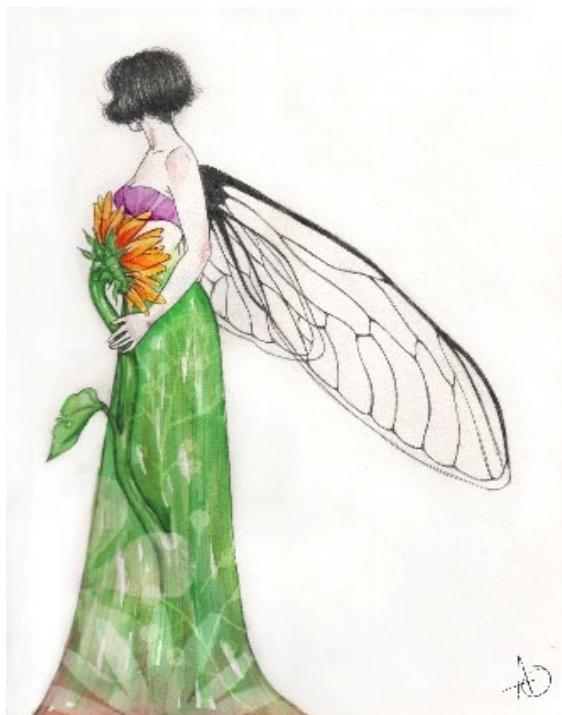
De la serie Hadas "Cigarra" Lápiz y acuarela sobre canson, edición digital, 2020.