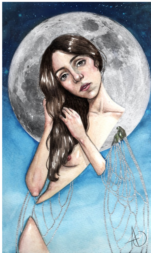
"Moon" Acuarela sobre papel, edición digital, 2020.