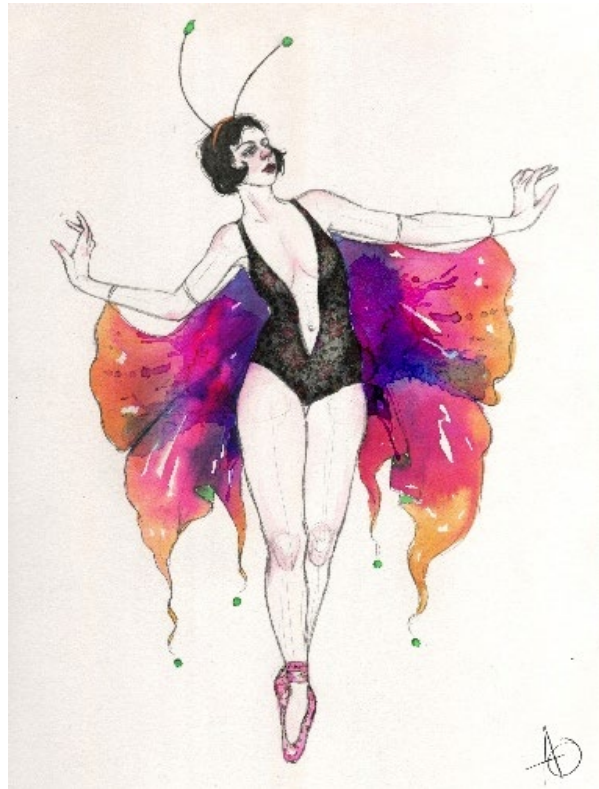
De la serie Hadas "Mariposa" Lápiz y acuarela sobre canson, edición digital, 2020.