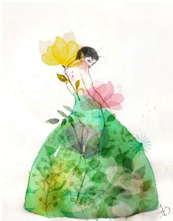
De la serie Hadas "Terra" Lápiz y acuarela sobre canson, edición digital, 2020.