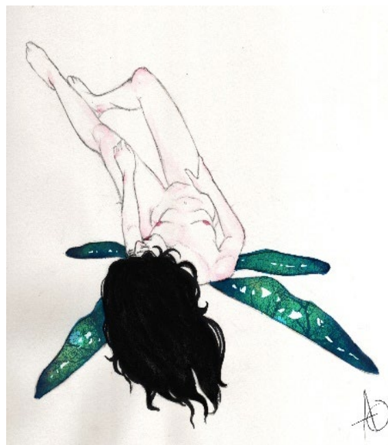
De la serie Hadas "Libélula" Lápiz y acuarela sobre canson, edición digital, 2020.