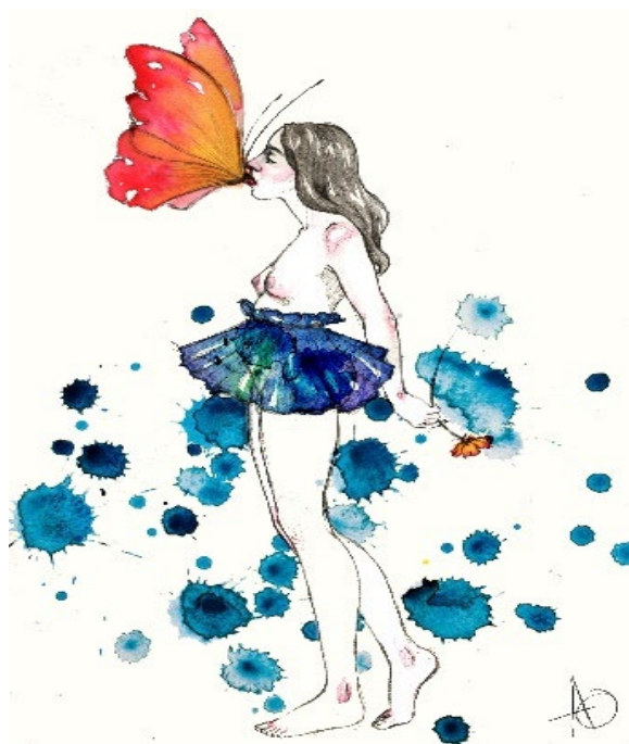
De la serie Hadas "Beso" Lápiz y acuarela sobre canson, edición digital, 2020.