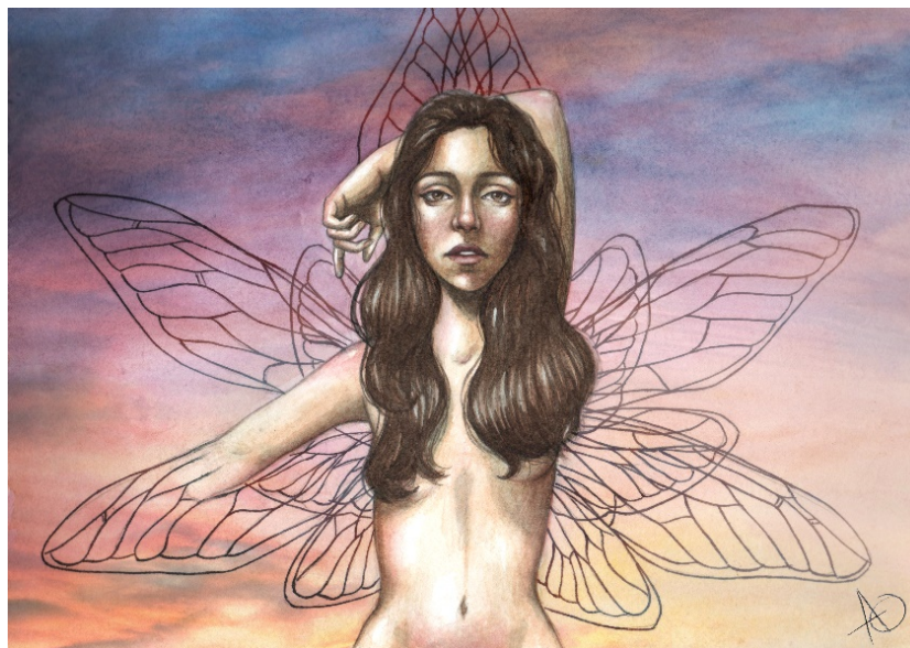
"Volar" Acuarela sobre papel, edición digital, 2021.