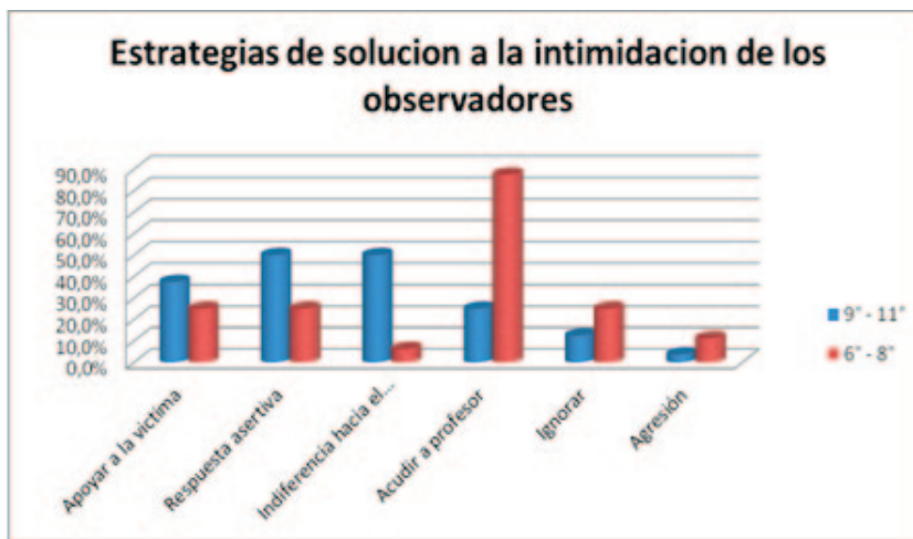
Figura 5. Estrategias de solución de la intimidación entre pares en el lugar de Observador; diferencia por grupo de edad

De igual manera, en el rango de 11 a 13 años la estrategia más usada por el 87.5 % fue “buscar la ayuda de un profesor” para darle solución a la intimidación. Asimismo, “auxiliar y alentar a la víctima”, “ignorar la agresión”, así como “emitir una respuesta asertiva” se presentaron en un porcentaje de 25 % cada una. “Agredir al intimidador” y “demostrar indiferencia” hacia este fueron las estrategias menos reportadas para solucionar el problema, con 11.2 y 6.2 %, respectivamente.