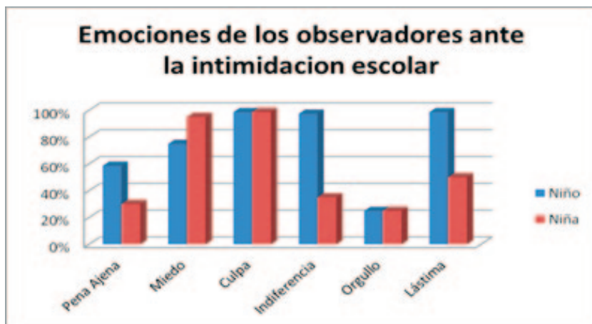
Figura 2. Emociones atribuidas a los observadores; diferencias por sexo

Finalmente, la compasión o lástima fue una emoción mencionada constantemente por niños y niñas, quienes manifestaron que los observadores la experimentan principalmente cuando la víctima “es un amigo cercano”, aunque refirieron que también la pueden experimentar simplemente por el hecho de ver que esa persona “está sufriendo” a causa de lo que le está ocurriendo. Con respecto al sexo, curiosamente se encuentra que el 99 % de los niños informaron que la han experimentado, mientras que las niñas solo la reportaron en un 50%.