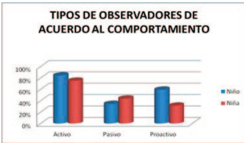
Figura 3. Tipo de observador de acuerdo con el comportamiento; diferencias por sexo