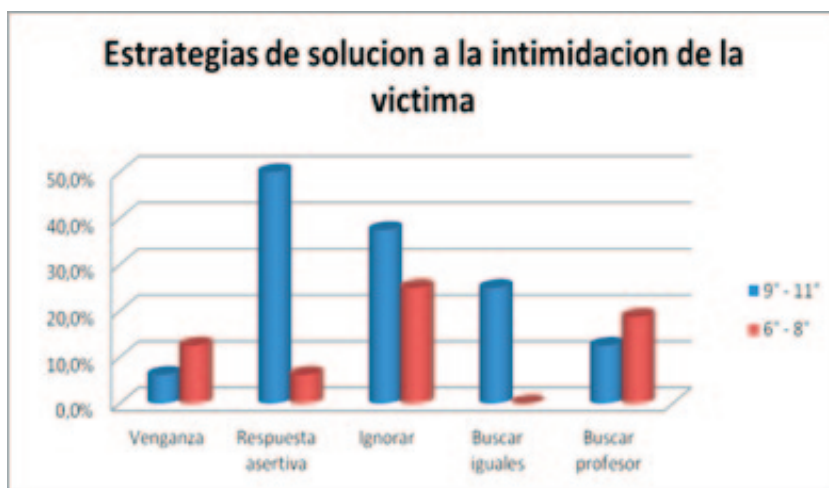
Figura 4. Estrategias de solución de la intimidación entre pares en el lugar de la Víctima; diferencia por grupo de edad

En cuanto a la pregunta ¿qué harían para sentirse mejor si fuesen víctimas? , manifestaron que “pondrían mucho más atención a su autoestima”, trabajando más al respecto para que las intimidaciones recibidas “no los debiliten”, “no asuman los señalamientos” de los intimidadores ni “experimenten los sentimientos” que ellos pretenden provocarles. Los participantes de menor edad expresaron que ellos pensarían que las agresiones “van dirigidas hacia otra persona”, con el fin de no creer “las cosas malas o desagradables” que el agresor dice de ellos.