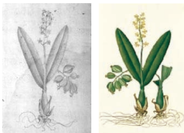
Figura 6.- Prosthechea vespa (Vell.) W.E. Higgins, Orchidaceae. Izquierda, boceto a lápiz atribuido a Matís, derecha lámina No. A-415 en folio mayor de la Colección Mutis (Archivo del Real Jardín Botánico, CSIC, Madrid).