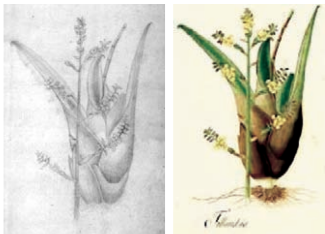
Figura 5.- Racinaea subalata (André) M.A.Spencer & L.B. Smith. Bromeliaceae. Izquierda, boceto a lápiz atribuido a Matís, derecha lámina No. A-307 en folio mayor de la Colección Mutis (Archivo del Real Jardín Botánico, CSIC, Madrid).