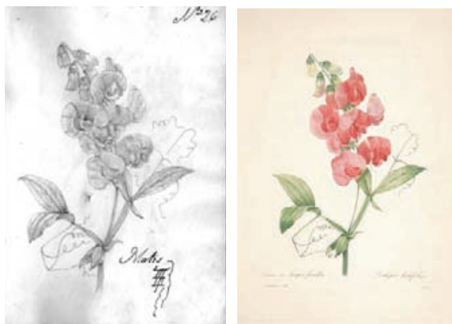
Figura 18.- Lathyrus latifolius L., Fabaceae. Izquierda Boceto no. 26 atribuido a Matís. Derecha, Lámina no. 2 de Choix des plus belles fleurs et de plus belles fruits , obra de Pierre Joseph Redouté.