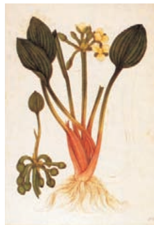
Figura 2.- Limnocharis flava (L.) Buch. Hydrocharitaceae. Izquierda, boceto a lápiz atribuido a Matís, derecha lámina No. A-234 en folio mayor de la Colección Mutis (Archivo del Real Jardín Botánico, CSIC, Madrid).