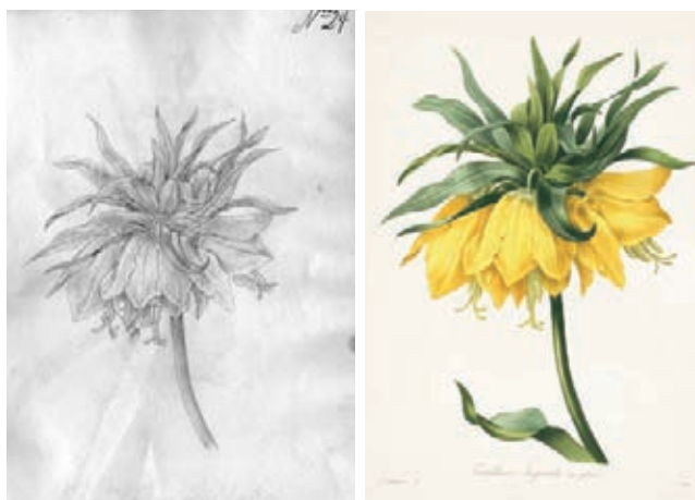
Figura 13.- Fritillaria imperialis L. Liliaceae. Izquierda, boceto no. 24 atribuido a Matís. Derecha, Imagen tomada de la lámina no. 2 de Choix des plus belles fleurs et de plus belles fruits , obra de Pierre Joseph Redouté.