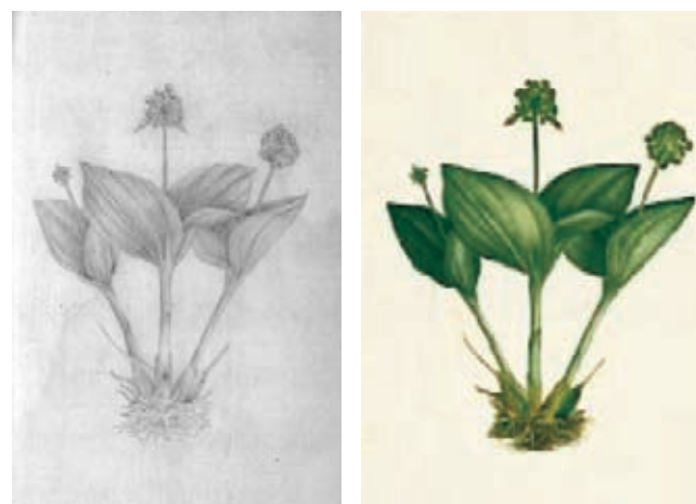
Figura 8.- Malaxis parthonii Morr. Orchidaceae. Izquierda, boceto a lápiz atribuido Matís, derecha lámina No. A-579 en folio mayor de la Colección Mutis (Archivo del Real Jardín Botánico, CSIC, Madrid).

mayor, que carece de la firma de su autor, le fue añadida otra planta con los frutos que no figura en el dibujo a lápiz y por ello el diseño de las raíces se modificó. El boceto carece de firma. (Figura 6)