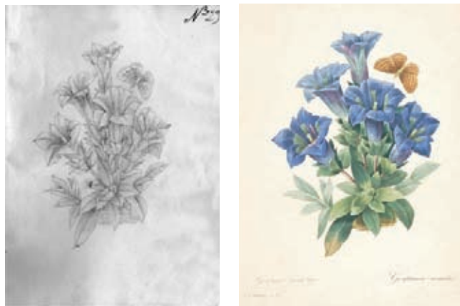
Figura 21.- Gentiana acaulis L., Gentianaceae. Izquierda, boceto no. 29 atribuido a F. J. Matís. Derecha Lámina no. 97 de la obra Choix des plus belles fleurs et de plus belles fruits , de Pierre Joseph Redouté.

21.- Boceto No. 29. Gentianaceae. Gentiana acaulis L., planta de origen europeo. Corresponde a una copia de la Lámina 97 de la obra Choix des plus belles fleurs et des plus belles fruits de Pierre Joseph Redouté (1827-1833). En la lámina se incluye la representación de un lepidóptero el cual fue copiado burdamente. (Figura 21).