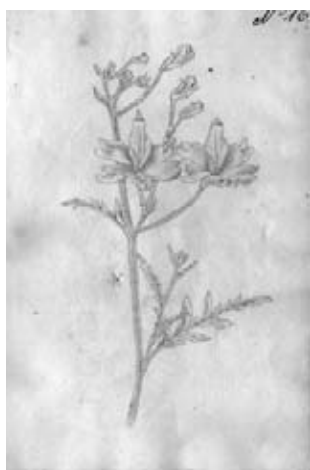
Figura 14.- Boceto No. 16 atribuido a Matís. Figura indeterminada con apariencia de Papaveraceae. La especie representada no corresponde a la flora nativa colombiana y posiblemente fue copiada de un libro de jardinería editado en Europa.

13.- Boceto No. 16. Indeterminada. Recuerda a alguna Papaveraceae. Probablemente la representación de alguna lámina de una obra de jardinería publicada. (Figura 14).