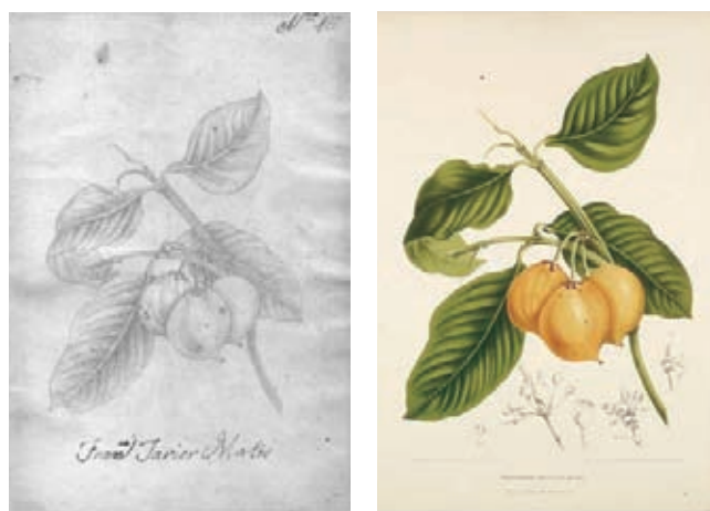
Figura 12. Garcinia dulcis (Roxb.) Kurz, Clusiaceae. Izquierda, boceto a lápiz atribuido a Matís, derecha lámina No. 15 de Fleurs, Fruits et feuillages choisis de L'île de Java , pintura de Berthe Hoola van Nooten.