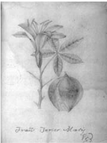
Figura 1.- Ceiba schottii Britten & Baker f. vel aff. Bombacaceae. Boceto a lápiz en pequeño formato atribuido a Francisco Javier Matís.

4.- Bromeliaceae. Tillandsia turneri Baker. El boceto, con la firma de Matis coincide plenamente con el diseño de la lámina policroma distinguida con el número 306, la cual carece de la firma del autor. De esta especie existe además la réplica en negro (306a) que serviría de modelo al grabador. (Figura 4).