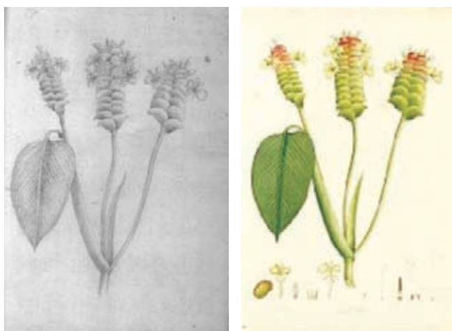
Figura 10.- Calathea insignis Peters. Maranthaceae. Boceto a lápiz atribuido a Matís. Derecha, lámina No. A-604 en folio mayor de la Colección Mutis. (Archivo del Real Jardín Botánico, CSIC, Madrid).