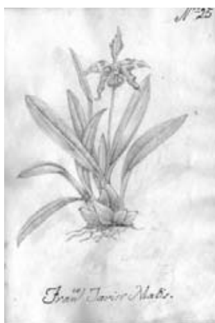
Figura 17.- Boceto no. 25 atribuido a F.J. Matís. Odontoglossum sp. Orchidaceae.

18.- Boceto No. 26. Fabaceae. Lathyrus latifolius L., planta de origen euroasiático. Corresponde a una copia de la Lámina 98 de la obra Choix des plus belles fleurs et de plus belles fruits de Pierre Joseph Redouté (1933). (Figura 18).