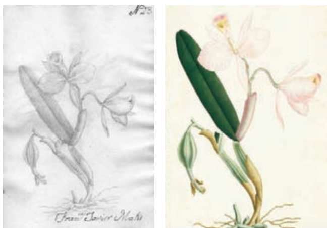
Figura 9.- Cattleya trianae Lindl. & Rchb. Orchidaceae. Izquierda, boceto a lápiz atribuido Matís, derecha lámina No. A-428 en folio mayor de la Colección Mutis (Archivo del Real Jardín Botánico, CSIC, Madrid).

10.- Maranthaceae. Calathea insignis Peters. El dibujo a lápiz coincide con la lámina policroma en folio mayor distinguida con el número 604. Es esta una de las láminas en las cuales fueron añadidos en la parte inferior los dibujos anatómicos. Carece de la firma de su autor, al igual que la réplica