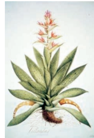
Figura 3.- Tillandsia biflora Ruiz & Pav. Bromeliaceae. Izquierda, boceto a lápiz atribuido a Matís, derecha lámina No. A-299 en folio mayor de la Colección Mutis (Archivo del Real Jardín Botánico, CSIC, Madrid).