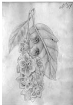
Figura 15.- Boceto No. 17, dibujo atribuido a Matís. Especie indeterminada. La planta representada no corresponde a la flora nativa colombiana y posiblemente fue copiada de un libro de jardinería editado en Europa.

14.- Boceto No. 17. Indeterminada. Probablemente la representación de alguna lámina de obra de jardinería publicada. (Figura 15).