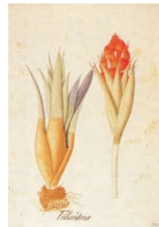
Figura 4.- Tillandsia turneri Baker. Bromeliaceae. Izquierda, boceto a lápiz atribuido Matís, derecha lámina No. A-306 en folio mayor de la Colección Mutis (Archivo del Real Jardín Botánico, CSIC, Madrid).

5.- Bromeliaceae. Racinaea subalata (André) M.A. Spencer & L.B. Smith. El boceto no lleva firma y en su diseño coincide plenamente con la lámina en folio mayor distinguida con el número 307, aunque en el dibujo a lápiz no están detalladas las raíces. La lámina cuenta con una réplica en negro (307a). Este boceto fue determinado por Julio Betancur. (Figura 5)