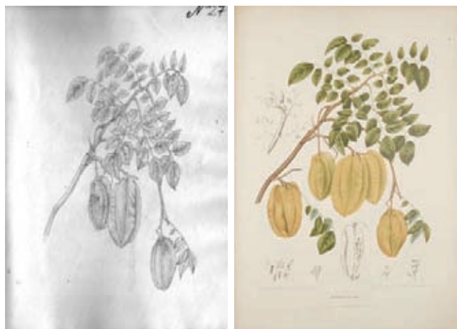
Figura 19.- Averrhoa carambola L., Oxalidaceae. Izquierda, boceto no. 27 atribuido a Matís. Derecha Lámina no 36 de la obra Fleurs, Fruits et feuillages choisis de L'île de Java , de Berthe Hoola van Nooten.

19.- Boceto No. 27. Oxalidaceae. Averrhoa carambola L., planta de origen Indomalayo introducida a América y las Antillas. Corresponde a una parte de la lámina nº 36 de la obra: Fleurs, fruits et feuillages choisis de l'île de Java: peints d'après nature . (van Nootenv, 1880), donde esta planta aparece con el nombre de Averrhoa bilimbi L. (Figura 19).