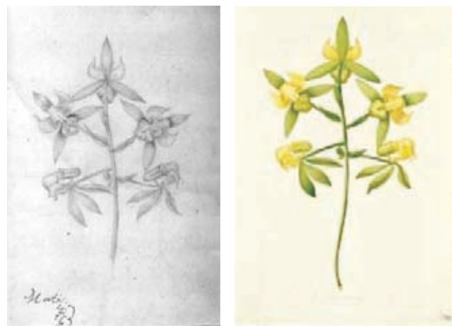
Figura 7.- Coryanthes summeriana Lindl. Orchidaceae. Izquierda, boceto a lápiz atribuido Matís, derecha lámina No. A-458 en folio mayor de la Colección Mutis (Archivo del Real Jardín Botánico, CSIC, Madrid).