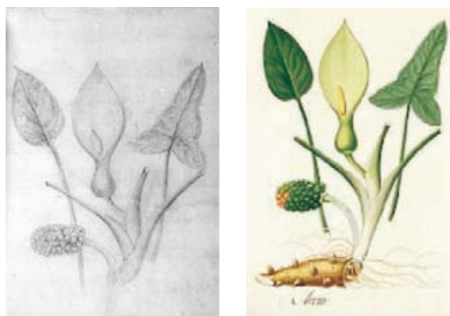
Figura 11.- Araceae. Izquierda, boceto a lápiz atribuido a Matís, derecha, lámina en folio mayor, distinguida con el No. A- 612 de la Colección Mutis. (Archivo del Real Jardín Botánico, CSIC, Madrid).

11.- Araceae. Xanthosoma cf. El dibujo coincide con la lámina distinguida con el número 612. Se trata de una imagen policroma de la autoría de Matís y que representa una aráce. Fue marcada como Arum y en ella están representados dos tipos de hojas aparte de una infrutescencia, además de la inflorescencia que aparece en la parte superior. La lámina en folio mayor lleva además un rizoma con sus yemas y raíces que no aparecen en el boceto. De la inflorescencia y de la