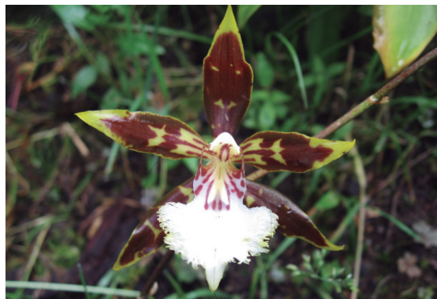
Figura 2. Flor de Oncidium nevadense

Tres de las cuatro especies del género Oncidium que crecen en el río Gaira están catalogadas como especies bajo amenaza: Oncidium gloriosum , O. naevium y O. nevadense ; la última de las tres es la única especie de Orchidaceae recolectada en este trabajo que se considera endémica para la Sierra Nevada de Santa Marta (Calderón-Sáenz, 2007) (Figura 2).