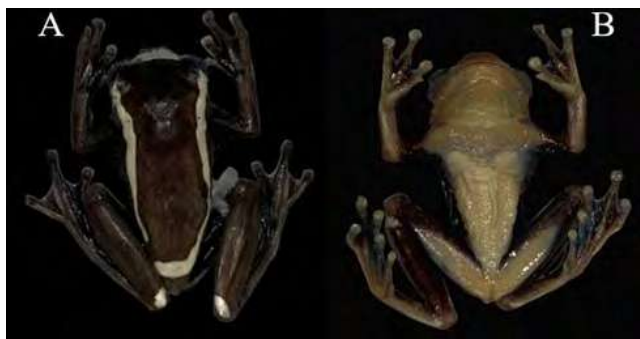
Figura 3. Vista dorsal (A) y ventral (B) de Dendropsophus manonegra . LCR 23 mm (UAM 1514 -MPO 061). Departamento de Caquetá, Colombia, Municipio de Florencia, vereda Paraíso

el saco bucal es de coloración verde; presenta dos parches glandulares ubicados en la región pectoral con una coloración blanca y separados entre sí, e iris marrón cobrizo con retículas pequeñas de color marrón oscuro (Figura 4) (Rivera-Correa & Orrico, 2013).