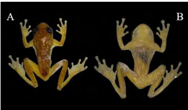
Figura 6. Vista dorsal (A) y ventral (B) de Dendropsophus sarayacuensis . LCR 18 mm (UAM 1486-DHR 015). Departamento de Caquetá, Colombia, Municipio de Belén de los Andaquíes, vereda Agua Dulce, finca las Brisas.

70 hasta 210 m s.n.m. (Cochran & Goin, 1970; Acosta, 2000; Lynch, 2005; Lynch, 2007; Lynch & Suárez, 2011; Osorno, et al. , 2011). Este nuevo registro de distribución en Caquetá demuestra que la distribución de este organismo es amplia, con variaciones altitudinales entre los 100 y los 300 m s.n.m. en esta zona del departamento, si se tiene en cuenta la distancia de los antiguos registros de distribución para la especie.