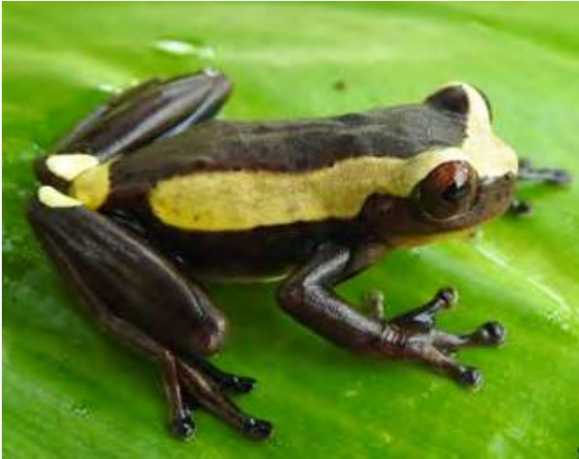
Figura 4. Vista lateral de ejemplar vivo de Dendropsophus manonegra . Departamento de Caquetá, Colombia, municipio de Florencia, vereda La Holanda.