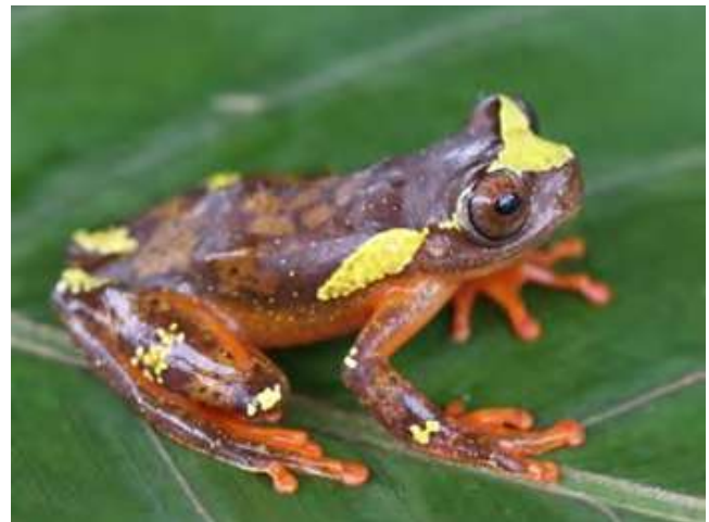
Figura 7. Vista lateral de ejemplar vivo de Dendropsophus sarayacuensis . Departamento de Caquetá, Colombia, Municipio de Belén de los Andaquíes, vereda Agua Dulce. Foto: D.H. Ruiz-Valderrama, 2019

Dendropsophus manonegra se diferencia de otras especies del complejo D. leucophyllatus por la presencia de una coloración negra azulada en sus regiones ocultas, membranas y dígitos (Rivera-Correa & Orrico, 2013). Se considera que es la única especie con esta coloración, en tanto que D. sarayacuensis , al presentar una coloración clara, suele confundirse con otras especies como D. leucophyllatus , pero se diferencia de esta por las bandas dorsolateral delgadas que llegan hasta la mitad del cuerpo y la formación de manchas irregulares en la superficies dorsales de las extremidades (Jungfer, et al. , 2010).