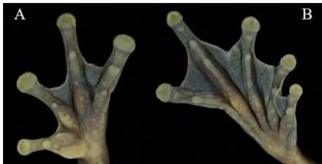
Figura 2. (A-B). Extremidad anterior izquierda con tubérculos subarticulares redondos, tubérculo palmar plano y dividido, tubérculo metacarpiano interno plano y alargado, y extremidad posterior derecha con tubérculos metatarsianos internos grandes y ovoides y tubérculos subarticulares redondos en Dendropsophus manonegra

que los dedos y las membranas interdigitales y axilares; tienen una línea bifurcada completa en las regiones cefálica y dorsolateral que se extienden hasta la ingle y manchas en el talón con una coloración amarilla (Figura 4B); el vientre, la barbilla, la garganta y las zonas ventrales de las extremidades anteriores y posteriores son de color gris;