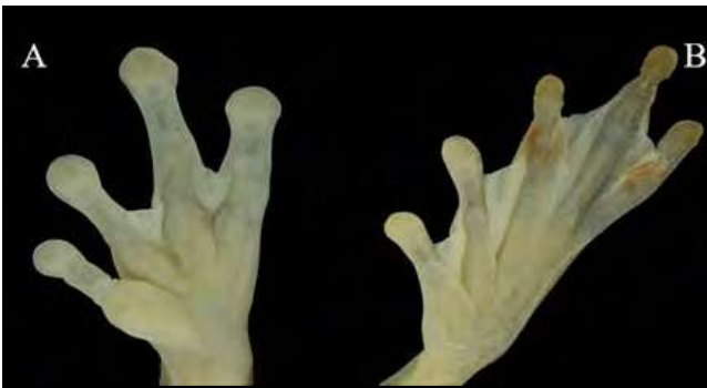
Figura 5. (A-B). Extremidad anterior izquierda con tubérculos subarticulares redondos, tubérculo metacarpiano interno plano y alargado, y extremidad posterior izquierda con tubérculos metatarsianos internos grandes y ovoideos, tubérculos subarticulares redondos en Dendropsophus sarayacuensis .