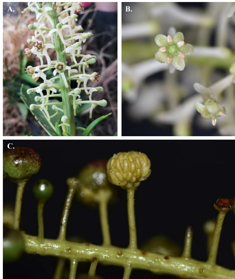
Figura 3. Souroubea caquetensis Gir.-Cañas, Edwin Trujillo & C. Parra-O. A y B. Inflorescencia y flores [E. Trujillo-T. et al. 7269 (COAH, COL, LAMUA)]; C. Frutos y semillas [E. Trujillo-T. et al. 8207 (COAH, COL, LAMUA)].

Etimología. El epíteto específico hace referencia al departamento de Caquetá (Colombia), de donde esta especie es endémica.