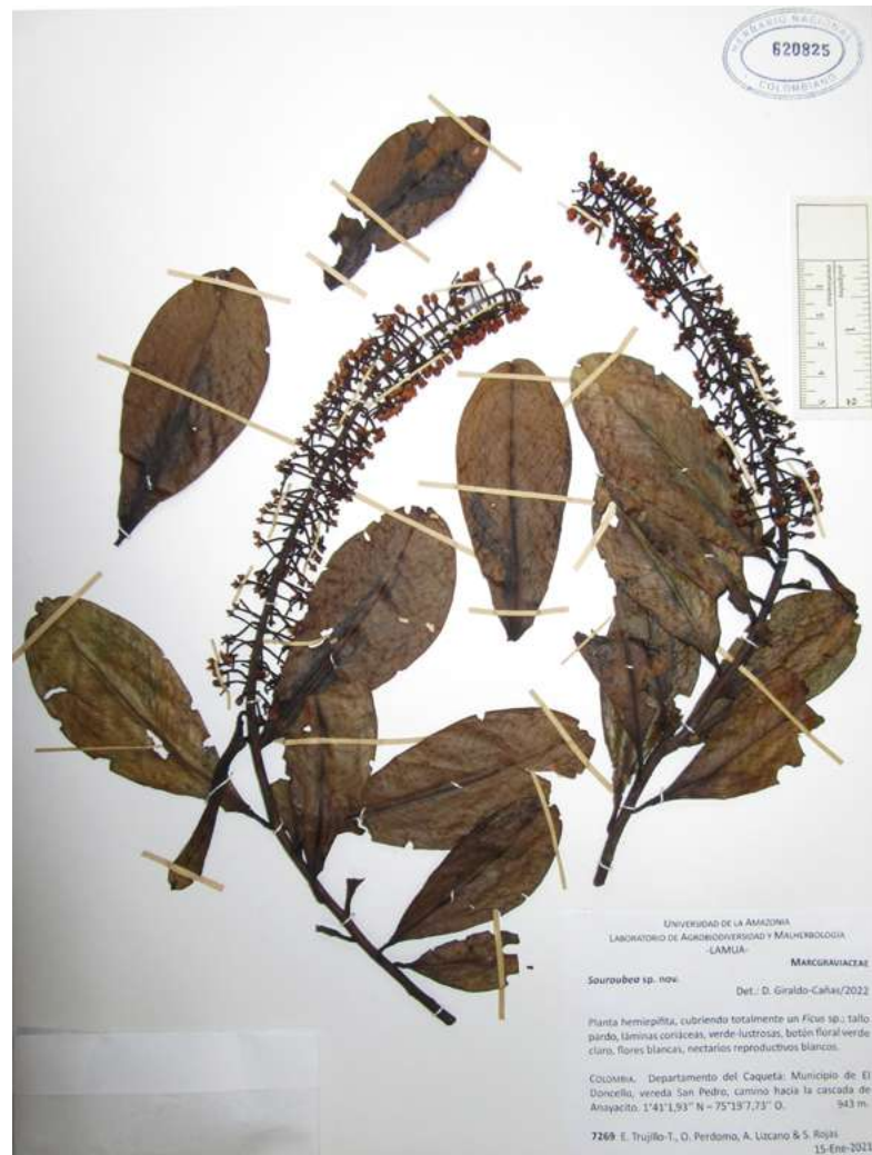
Figura 1. Holotipo de Souroubea caquetensis Gir.-Cañas, Edwin Trujillo & C. Parra-O. [E. Trujillo-T. et al. 7269 (COL)]