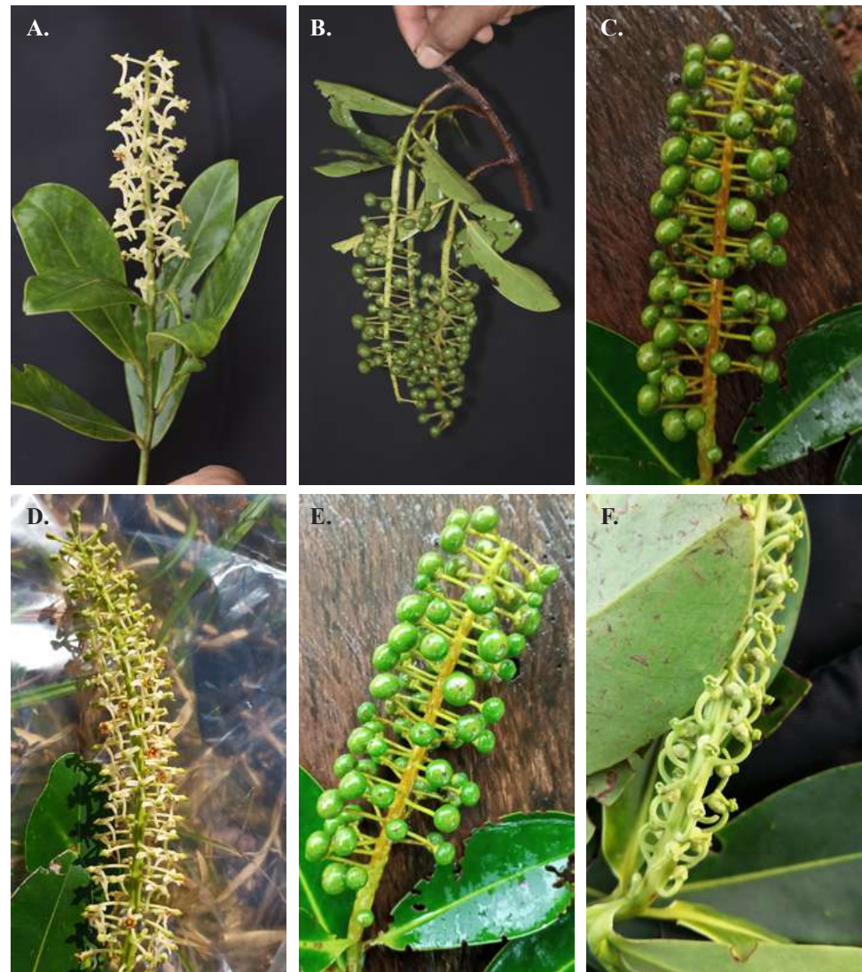
Figura 2. Souroubea caquetensis Gir.-Cañas, Edwin Trujillo & C. Parra-O. A, D y F. Inflorescencia (nótense en F algunas glándulas laminales en las hojas) [ E. Trujillo-T. et al. 7269 (COAH, COL, LAMUA)]; B, C y E. Infrutescencias [ E. Trujillo-T. et al. 8207 (COAH, COL, LAMUA)].

conspicua y débilmente reticulada, venación abaxial hifódroma; androceo 5 estambres, filamentos próximos entre sí y con su porción proximal adnata a la base de la corola, planos, largamente deltoides, amarillentos, carnosos, de 2,0–2,5 mm de longitud, porción proximal de los filamentos de 1,0–1,1 mm de ancho, porción media de 0,6–0,7 mm de ancho, porción distal de 0,5–0,6 mm de ancho; anteras oblongas, de 0,7–0,9 × 0,5–0,6 mm, carnosas, castaño claras; ovario 5-locular, cónico-piriforme, verde en fresco, negruzco al secarse, opaco, ligeramente estriado longitudinalmente cuando está seco, liso cuando está fresco, de 2,0–2,1 × 1,2–1,5 mm; estigma mamiforme, sésil, craso, inconspicuamente radiado, liso, de 0,6–0,7 mm de diámetro. Frutos globosos, dehiscencia irregular, ligeramente apiculados, verde oscuros y brillantes cuando están vivos, marrón oscuros y opacos cuando están secos, de 6–8 × 6–8 mm; número de frutos por infrutescencia (28) 44–70 (84); semillas numerosas, semilunares a reniformes, conspicuamente reticuladas, brillantes, amarillas cuando el fruto está vivo, cobrizas cuando el fruto está seco, de 2,6–3,2 × 1,1–1,5 mm.