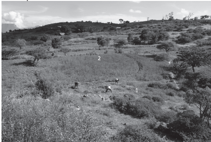
FOTO 6. Aterrazamientos cuyo arreglo de 1 o 2 son de carácter disperso. El número 1 corresponde a la excavación del corte 2 en el informe de resultados.

De acuerdo a nuestras evidencias y comparándolas con los resultados obtenidos por otros investigadores 30 podemos afirmar que hay dos tipos de asentamiento cuyo carácter bucólico del pasado, puede darnos un sentido de lo urbano: Uno conformado por pueblos centralizados en el poder político y autónomo, y otros con pequeños núcleos y patrones dispersos de ocupación, en función de las necesidades objetivas, los paisajes naturales y la disponibilidad de recursos. Así, las sociedades aborígenes que habitaron el actual territorio del Nororiente colombiano, han dejado unas huellas arquitectónicas, de ingeniería y unas prácticas sociales y culturales, que nos acercan a la comprensión de su desarrollo social, político, económico y religioso, que nos permite considerarlos en el nivel de desarrollo complejo adscrito al desarrollo de los cacicazgos.