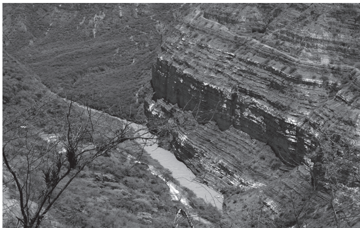
FOTO 2. Las tumbas en riscos de los cañones de los ríos. Cerca a Los Teres.

Esta conjunción entre la arquitectura doméstica y la mágico-ritual en la región de Los Santos, se materializa, por un lado, en las tumbas individuales en tierra, que se hallan en los llamados “calichos” y por el otro, corresponde a las tumbas colectivas en cavernas o cuevas, cuyo conjunto arquitectónico, al contener restos humanos que fueron depositados a través de un ritual, extiende el acto arquitectónico hacia las fronteras de un lenguaje simbólico con expresión material (arreglo en el paisaje) plasmado de manera realista en el arte rupestre (representaciones de deidades solares, plantas y animales del entorno natural), cuya ubicación a la entrada de las cuevas, impone la dinámica de la vida a través de actos rituales y elementos simbólicos asociados a la muerte; además, su cercanía a los asentamientos, configura el conjunto de elementos naturales y cotidianos, que al unirse -a través de las prácticas rituales-, de una parte, a la complejidad simbólica en el ritual y al arte rupestre y de otra, debido a la cobertura y globalidad en el espacio de elementos naturales y sociales, convierte el asentamiento preguane-guane, en un espacio ordenador del territorio, con connotaciones y características hacia primeras formas de agrupamiento de elementos naturales y culturales y una red compleja de relaciones sociales, que son elementos propios de los asentamientos nucleados y preámbulo de la vida urbana.