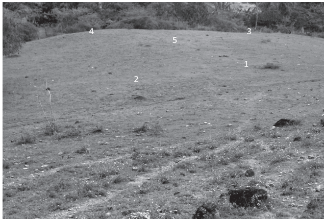
Foto 3. Evidencias de distribución de 5 aterrazamientos destinados a lugares de vivienda. Los Teres. Conforman un núcleo pequeños de asentamiento.

Las sociedades aborígenes que habitaron la región del Gran Santander y, que alcanzaron el nivel de desarrollo social de los cacicazgos, desarrollaron una arquitectura anclada sobre dos pilares fundamentales: los ámbitos doméstico y mítico-ritual las cuales incorporan un mundo conceptual que responde a un paisaje natural, respondiendo a la vida cotidiana (doméstico-casa residencial) y a la vida mágica-ritual, cuya cosmovisión facilita la conexión entre la vida y la muerte, que se puede observar a lo largo de la sociología religiosa 26 .