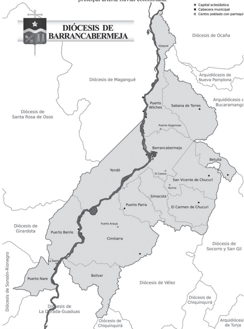
Imagen 1. Mapa de la diócesis de Barrancabermeja, atravesada de sur a norte por el río Magdalena, principal arteria fluvial colombiana.