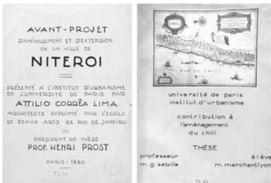
Figura 6. Primeras páginas de las tesis de Corrêa Lima (1930) y de Marchant Lyon (1941).

Nous avons cherché dans notre projet à mettre en valeur les beautés naturelles [sic] qui feront le premier attrait de la ville. Ensuite nous avons cherché à résoudre les différents problèmes de la ville. Nous n'avons pas sacrifier [sic] les besoins de la ville pour obtenir des aspects agréables. Peut être [sic] on acceptera difficilement l'idée du Pont reliant les deux villes. On pourra répondre en montrant la somme des bénéfices apportés par celui-ci à l'agglomération, et puis par la possibilité de pouvoir contempler le paysage d'un nouveau [point de vue qui donnera un aspect]