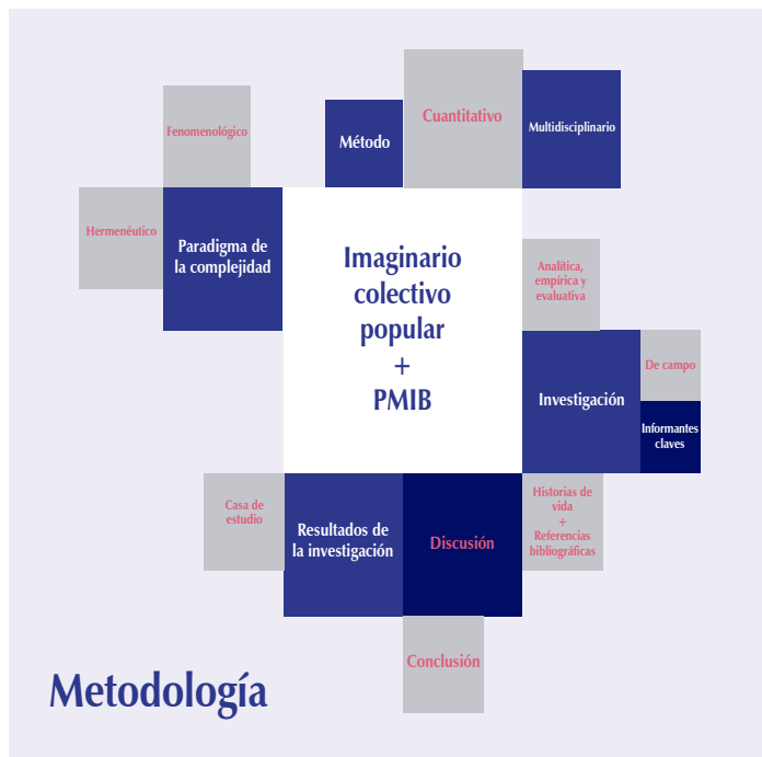
Figura 1. Esquema metodológico.

Fuente: elaboración propia (2020). CC BY-NC-ND