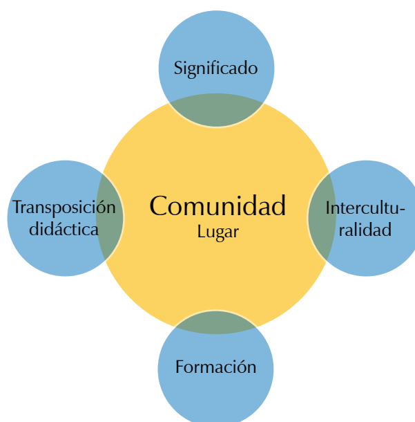
Figura 1. Características de la herramienta pedagógica.

El tour del grafiti surge como una iniciativa articuladora de las expresiones artísticas de los grafiteros de la Comuna 13, en un esfuerzo por visibilizar las manifestaciones culturales generadas por los pobladores como respuesta a una serie de acontecimientos violentos que, como