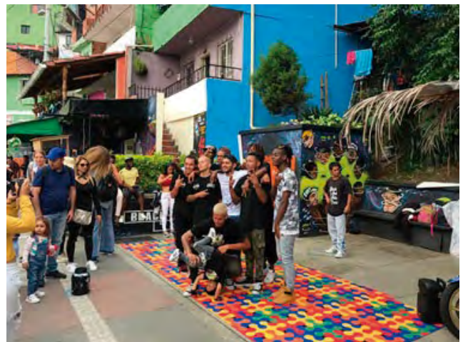
Figura 8. Grupo de Danza de Hip Hop.