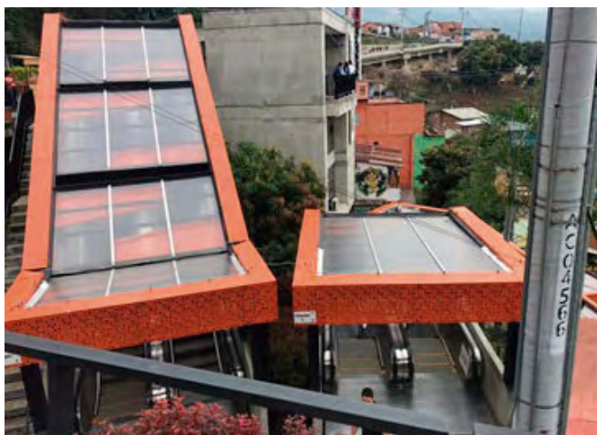
Figura 7. Escaleras eléctricas.

Si bien se reconoce que, como estrategia pública a un reconocimiento del fenómeno, se están realizando recorridos similares en distintas ciudades alrededor del mundo, y que este tour no es una única muestra de la práctica con cierto valor estético, sí se lo debe diferenciar de otras intervenciones de este tipo, al ser un evento de apropiación y gestión comunitaria como parte del proceso de reconstrucción de la comunidad misma. El Tour del Grafiti de la Comuna 13 relata, en cada una de las paredes de los barrios, una historia de abandono estatal que con el trabajo de sus líderes comunitarios llamaron la atención de las entidades gubernamentales y dieron la fuerza inspiradora a los diferentes actores para potenciar y revitalizar este sector dando paso a elementos que construyen dinámicas urbanas que trascienden límites y multiplican acciones de recuperación tanto paisajística como de recuperación económica.