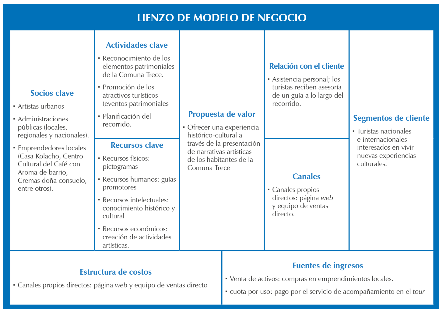
Figura 5. Business Model Canvas el Tour del Grafiti.