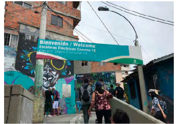
Figura 3. Inicio del Tour del Grafiti Comuna 13: escaleras eléctricas.