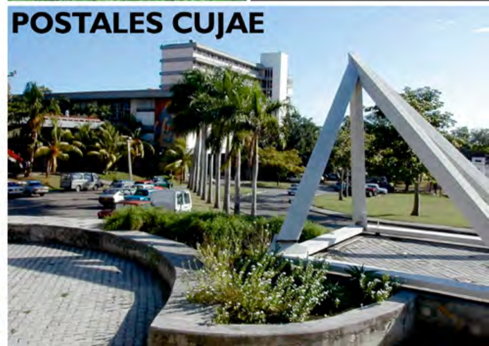
Figura 3. Selección de postales Cujae. Fuente: elaboración propia (2022).