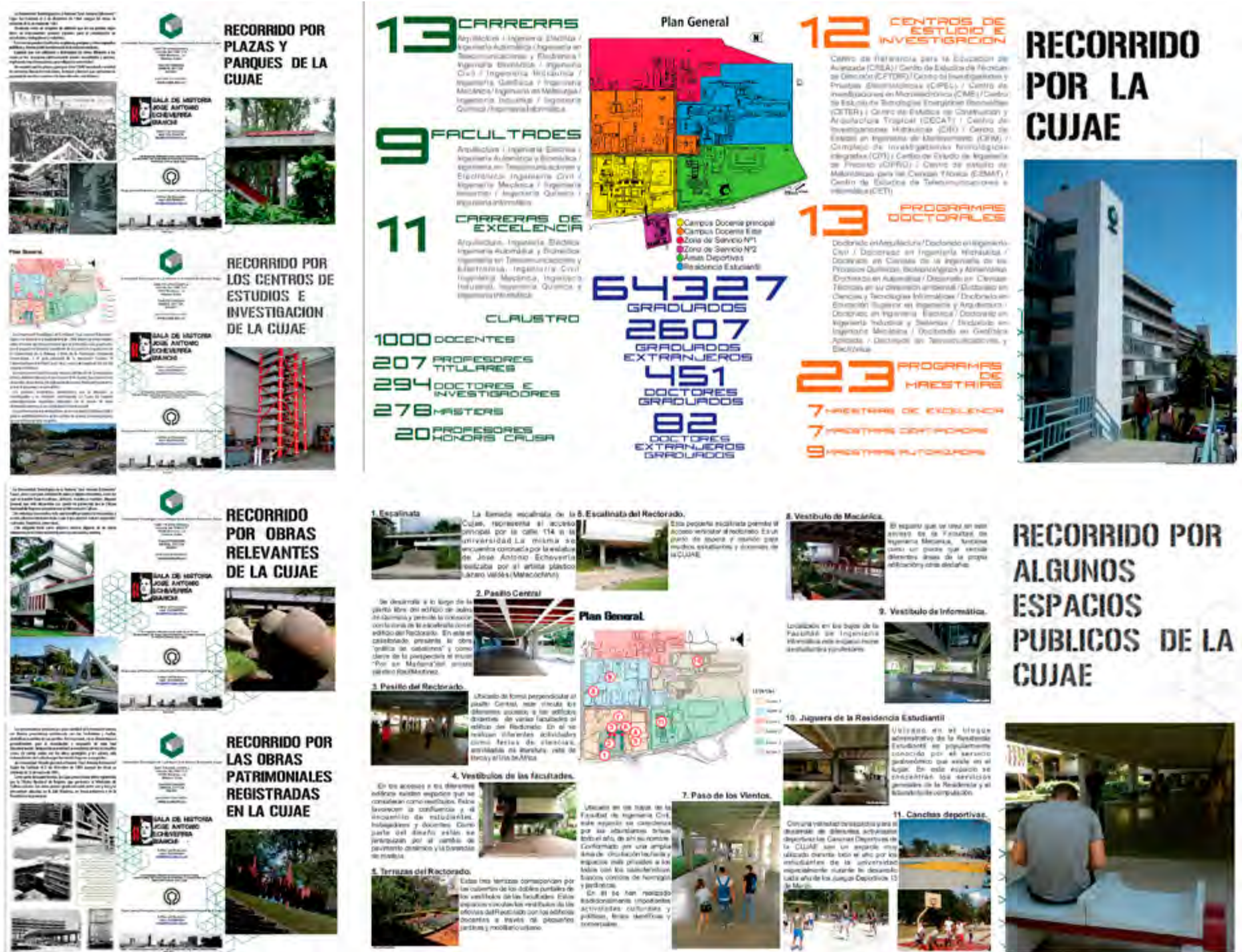
Figura 1. Plegables Cujae.