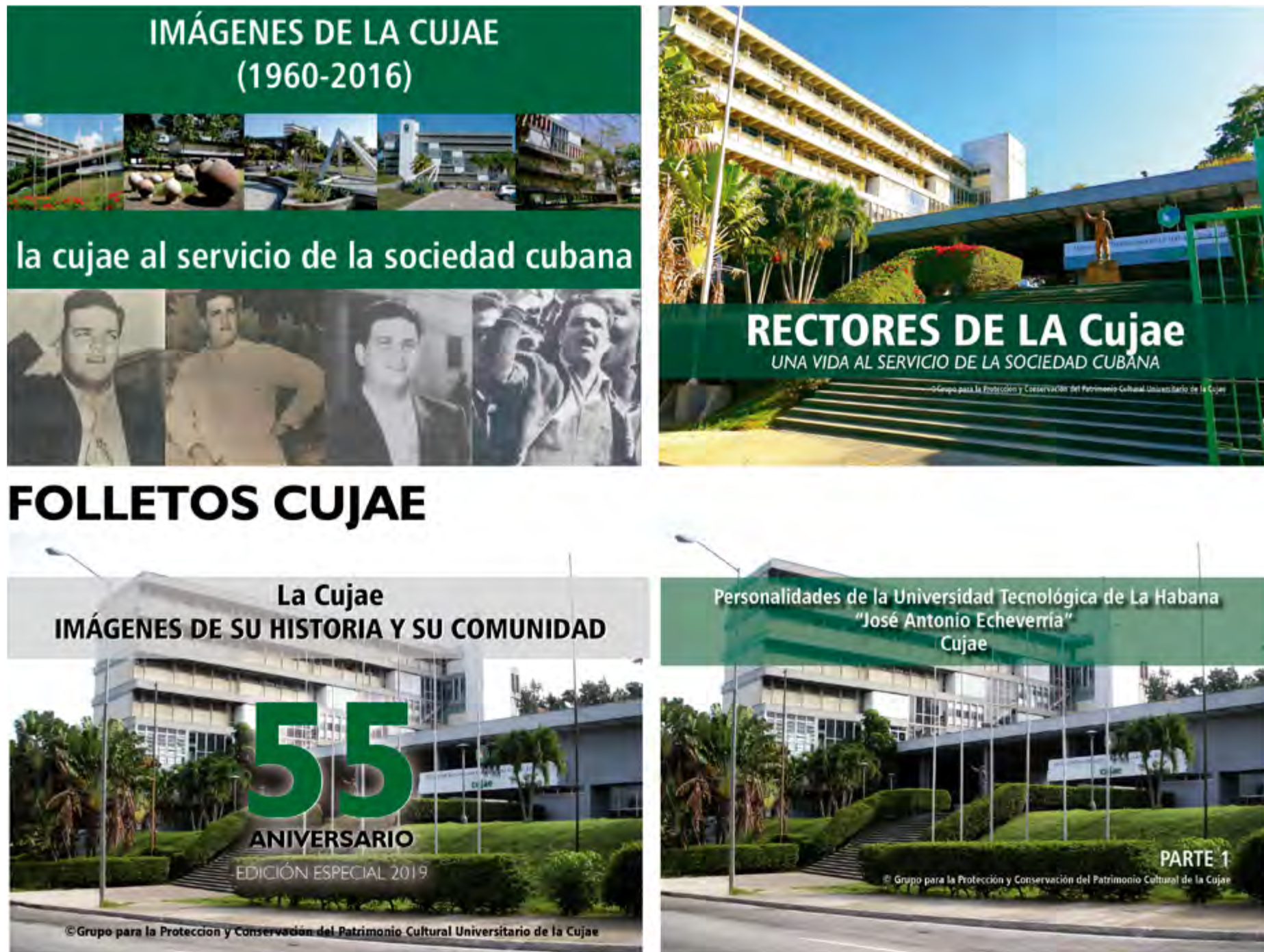
Figura 2. Ejemplos de folletos diseñados por el GPCU.