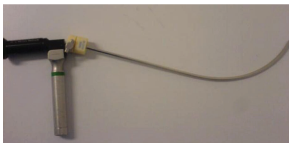
Figura 3: Dispositivo Airway RIFL.

The device was prepared with lidocaine gel and a 7.5 tube; traction of the lower jaw was performed for a mid-line approach, maintaining the vision on the proximal optic of the device. Upon visualizing the epiglottis and entering the glottis, the endotracheal tube is advanced up to the trachea, the Airway RIFL is removed and the endotracheal tube is fixed (Figure 4), followed by the immediate administration of 50 mg of propofol I.V.