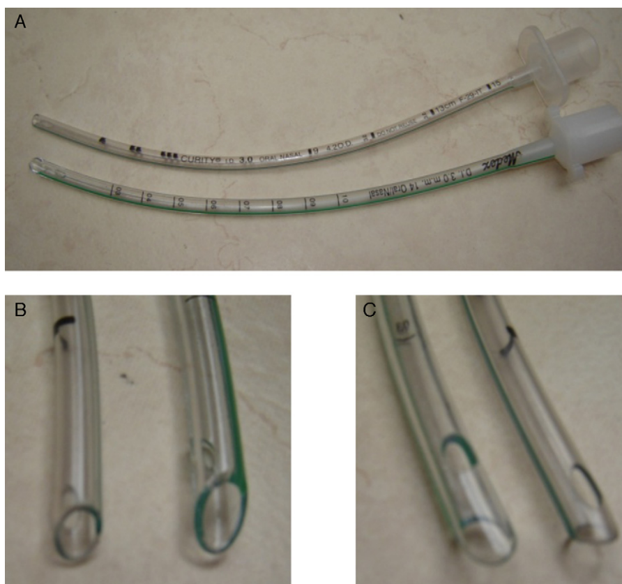
Figura 2 – Dos clases de tubos endotraqueales de igual diámetro interno (A), de diferente diámetro externo (B) y con distinto diseño de puntas (C).

En conclusión, aunque hay situaciones en las que los tubos con balón tienen ventajas sobre los tubos sin balón, ambos pueden causar lesiones al paciente. La intubación por