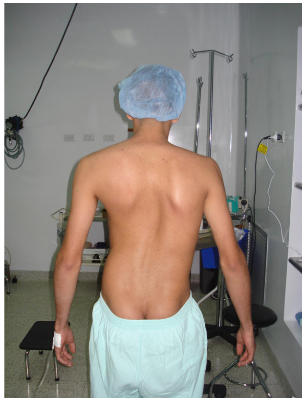
Figura 1 – Imagen del paciente antes de la primera cirugía.