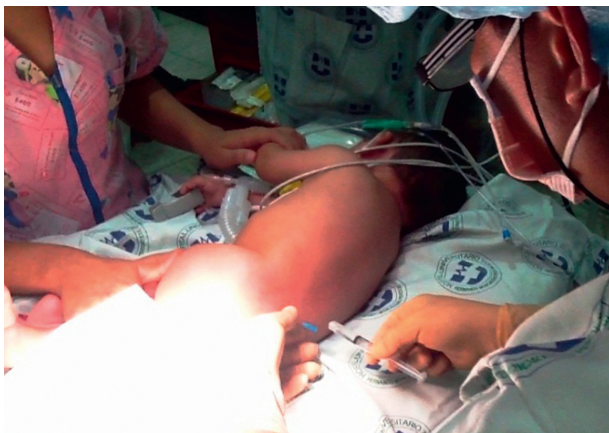
Figura 2 – Punción lumbar.

administra por vía intravenosa: dexametasona 1 mg; ketorolaco 2,5 mg; ondansetrón 1 mg y cefazolina 500 mg.