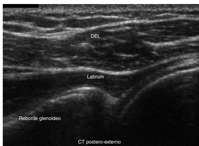
Figura 3 – Infiltración de 3 ml en la articulación glenohumeral.