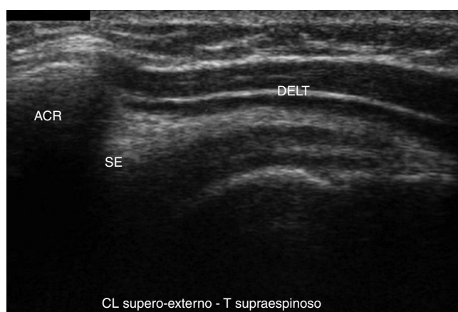
Figura 2 – Infiltración de 4 ml en la bursa subdeltoidea.