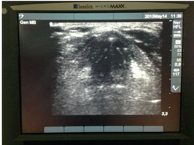
Figura 2 – Caso 1. Cuerdas vocales y cartílagos aritenoides.