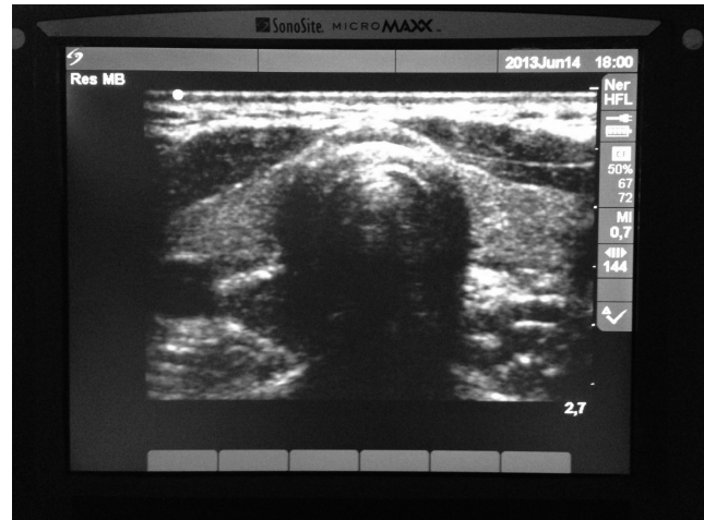
Figura 3 – Tráquea y arteria carótida.