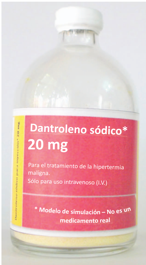
Figura 5. Modelo listo para simular la reconstitución del dantroleno.