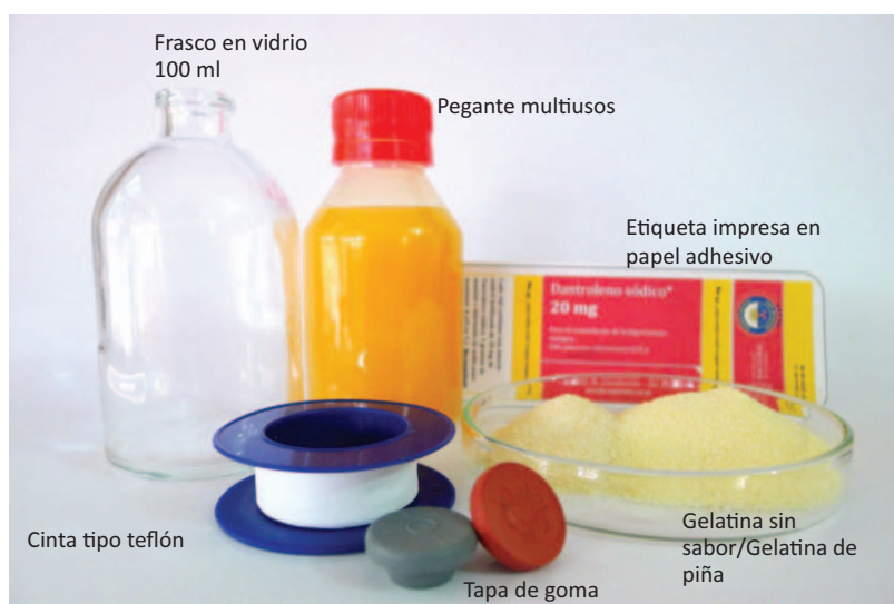
Figura 1. Materiales para la preparación del modelo.