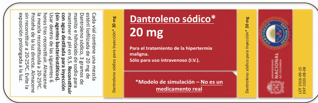
Figura 2. Etiqueta para vial de simulación. El tamaño para impresión debe ajustarse a las dimensiones del recipiente en vidrio al momento de imprimir.

dedicadas a la fabricación de artículos en vidrio; son de bajo costo y fácil obtención. La presentación del medicamento viene en viales de 70 ml, sin embargo las botellas en vidrio de 100 ml se adquieren con más facilidad.