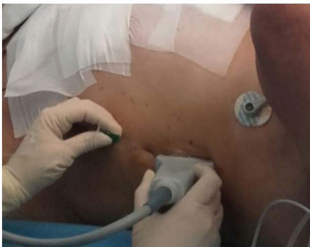
Figura 1. Posición del paciente, sonda y plano de entrada.

Todos los pacientes descritos firmaron el consentimiento informado previo a la realización de la técnica anestésico-analgésica objeto de la serie de casos (BRILMA modificado). Este bloqueo fascial se realiza bajo visión ecográfica (equipo portátil M-Turbo, Sonosite®, Bothell, WA, USA), utilizando una sonda lineal de alta frecuencia 6–15 Hz y aguja 80 mm Ultrplex 360 (B. Braun®, Germany). Con el paciente en decúbito supino, se coloca la sonda en el plano sagital de la línea media axilar (Fig. 1) para