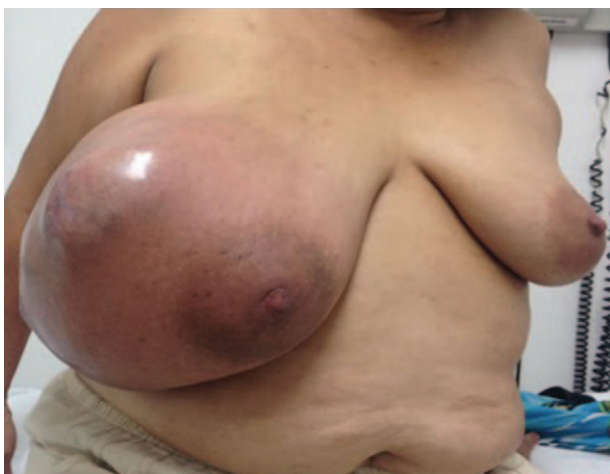
Figura 1. Masa en mama pre quirúrgico.

Paciente de 50 años, de sexo femenino, ama de casa, ingresa al Hospital Universitario de Santander, por consulta externa de gineco oncología, con cuadro clínico de 8 años de evolución de masa en mama derecha inicialmente orientado como fibroadenoma la cual en los últimos 7 meses ha presentado un crecimiento rápido y progresivo hasta ocupar toda la mama, asociado a dolor intenso e incapacitante. Trae reporte de biopsia de Noviembre de 2016 con resultado de tumor phylloides, sin antecedentes de importancia, última citología cervico uterina marzo de 2017 normal. Paraclínicos de ingreso: Cuadro hemático muestra hemoglobina de 11.2 mg/dL, sin leucocitosis o neutrofilia. Al examen físico se encuentra paciente con peso de 62kg en aceptables condiciones generales con mama derecha completamente desplazada por gran masa tumoral de aproximadamente 20 cms de diámetro (Fig. 1), multilobulada con zonas de ulceración, sin sangrado activo. El tamaño de la masa limita la marcha y produce dolor constante. La paciente es